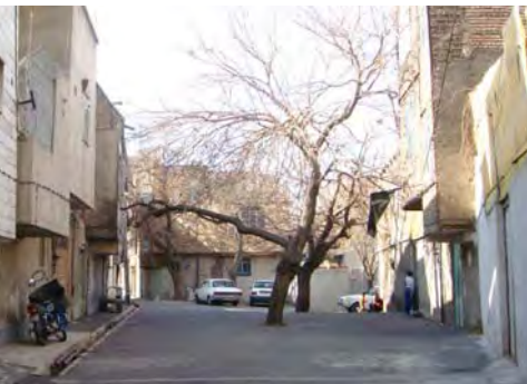
محله یافت آباد

هویت نه به‌عنوان «پوسته و امری الحاقی» بلکه به مثابه «تمود حقیقت» از شروط اساسی تداوم حیات اجتماعی-کالبدی شهر است. شهر، تبلور تاریخ و تمدن اجتماعی است که در آن زندگی می‌کند و هویت آن محصول سال‌های