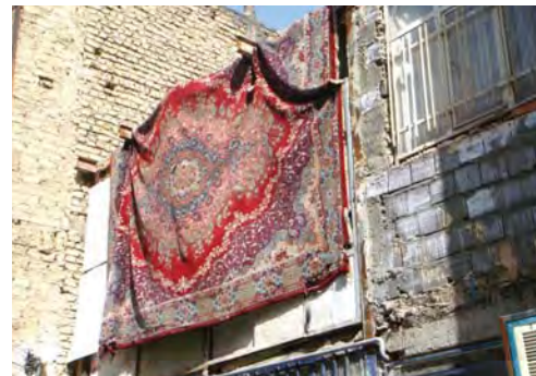
محله یافت آباد