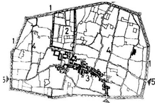
در تهران قدیم، عناصر غالب شهر عبارت است از: ۱- دیوارهای شهر ۲- اراک حکومتی ۳- بازار شهر، کاروانسراها، تیمچه‌ها، قیصریه‌ها و ... ۴- گذرهای اصلی ۵- دروازه‌ها (منصوری، ۱۳۸۳)