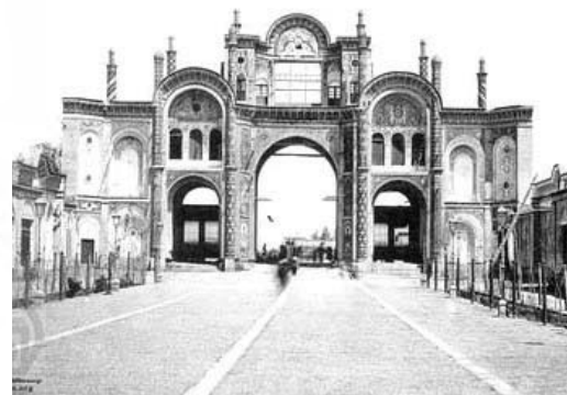
ورودی امروز تقلیدی ناآگاهانه از دیروز