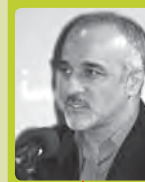
علیرضا عندلیب رئیس نهاد برنامه ریزی توسعه شهری تهران

قسمت اول این مقاله که در شماره اول ویژه نامه نهاد تهران ارائه گردید به طرح مسئله، ضرورت و اهمیت موضوع تشکیل نهاد و اشاره به سوابق و مراحل ایجاد و تکاملی آن تا به امروز پرداخت. نتیجه حاصل از آن بررسی به این دست یافت که فقدان چنین نهادی می تواند بزرگترین لطامت و ضربه ها را بر پیکره نظام برنامه ریزی و مدیریت توسعه شهری تهران وارد سازد و از این رو تهدیدی برای آینده این شهر محسوب گردد. بنابراین تشکیل نهادی فعال، قوی و کارآمد ضمن پاسخگویی به نیازهای فوق می تواند موجب بسترسازی برای تولید فرصت های جدید به منظور رشد و توسعه پایدار شهر تهران فراهم نماید. این فرصتی استثنایی از لحاظ تاریخی است که در اختیار سیاست گذاران، برنامه ریزان، تصمیم گیران و مدیران شهری قرار گرفته است و با استفاده از این فرصت می توان به تأمین آینده های پایدار برای تهران امیدوار بود.