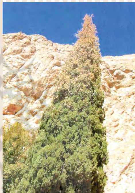
سرو کهن، زیارتگاه پیر سبز. یزد