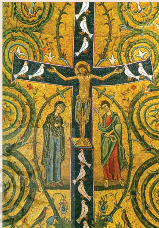
۲- درخت زندگی در قالب زندگی مسیح (ع)

در شمال نگاری مسیحی، صلیب عیسی (ع) نمودار درخت زندگی است که مسیح به منزله تنه درختی است که بر شاخه و برگهایش کبوتران سفید (پیک آشتی و رهایی)، دیده می شوند، (تصویر ۲)