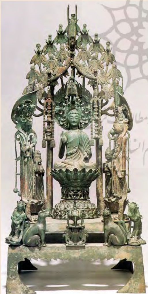
۱- بودا، درخت انجیر هندی

دانته، مجموع افلاک سپهر را چون قله یا تاج درختی تصویر می‌کند که ریشه هایش رو به سوی بالا دارند. ظهور خدا در درخت، مضمونی رایج در متون ودایی و هنر تجسمی شرق باستان است. در آثار هنری تمدن "مونه‌جودارو" ظهور خداوند در درخت "انجیر هندی"، در آثار هنری هند و بودایی تولد، تنویر و مرگ و رهایی خدایان و پیامبر در ارتباط با درخت مقدس است؛ (تصویر ۱)