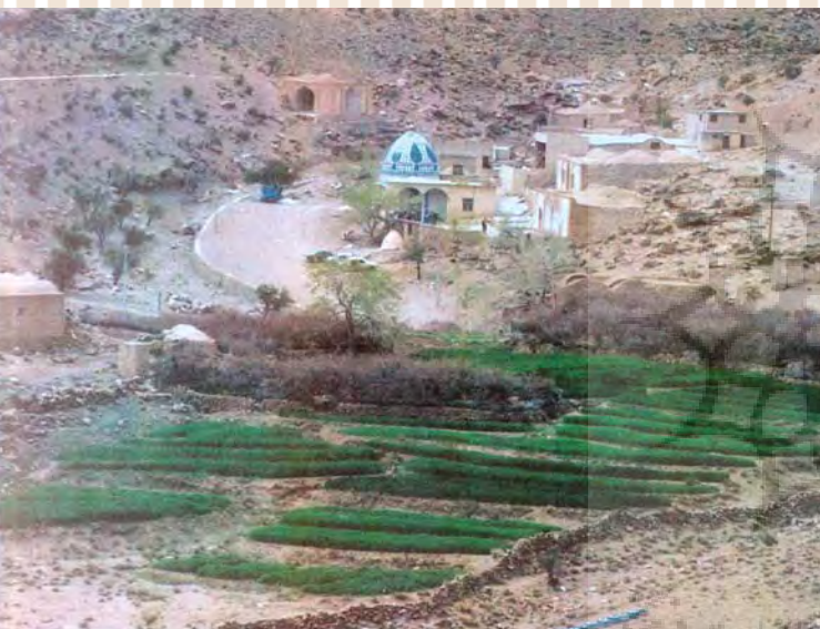
نقش سرو، برگنبد زیارتگاه "پارس بانو" یزد