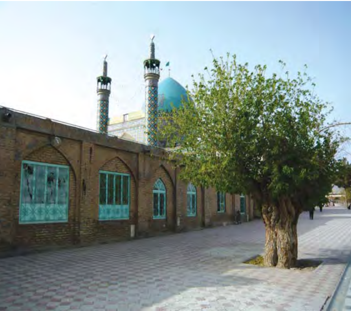
امامزاده حسین ابن موسی. طبس