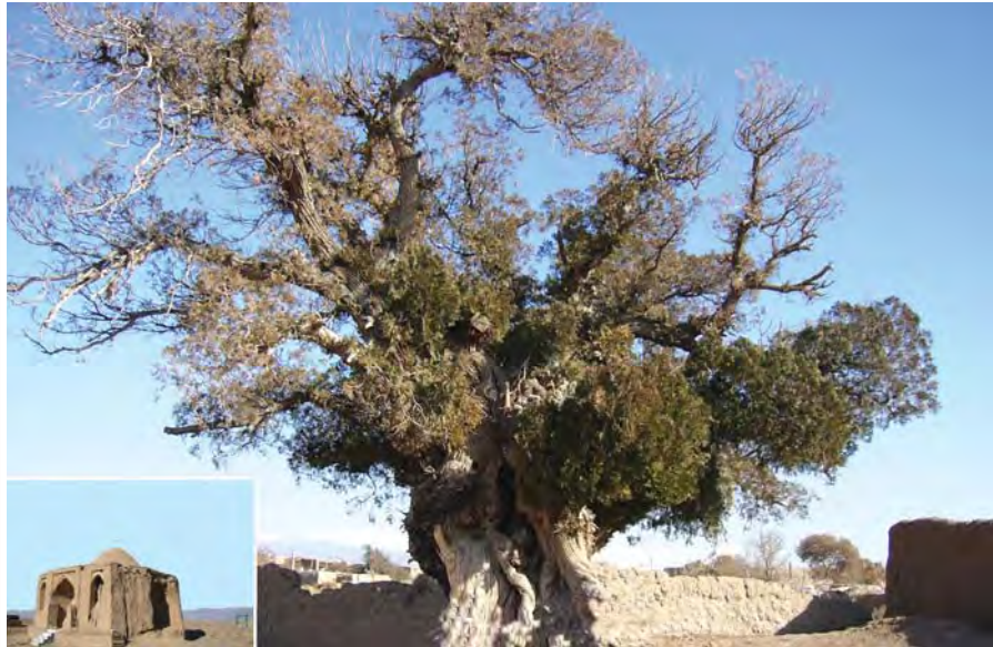
درخت سدر. امامزاده عبدالله. نیشابور. روستای جهان آباد