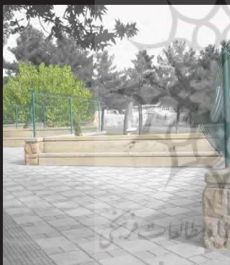
نمونه‌ای از مبلمان شهری مجاور پارک لاله