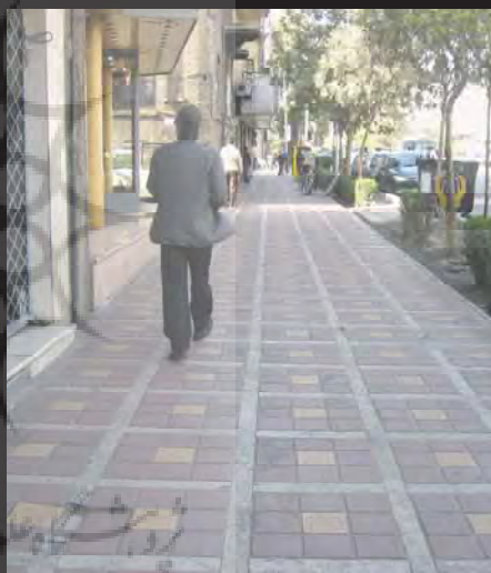
طراحی در پیاده‌روهای جمهوری