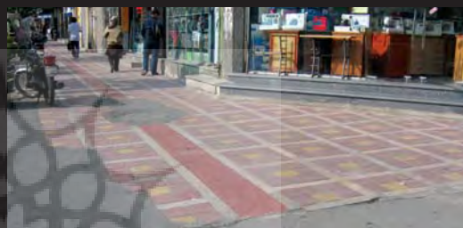
طراحی نامناسب در تقاطع (پیاده‌راه جمهوری)

آنچه از بررسی نمونه‌های مورد نظر در حوزه عملکردی پیاده‌رو بدست می‌آید بیانگر این موضوع است که اصول طراحی جهت استفاده همه اقشار و گروه‌های سنی از کودک تا کهنسال، در پیاده‌روهای خیابان ولیعصر به خوبی لحاظ شده است. ایجاد