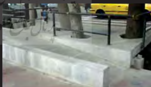
موانع، مسیر حرکت نابینا را قطع کرده است