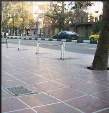
طراحی در پیاده‌روهای ولی عصر