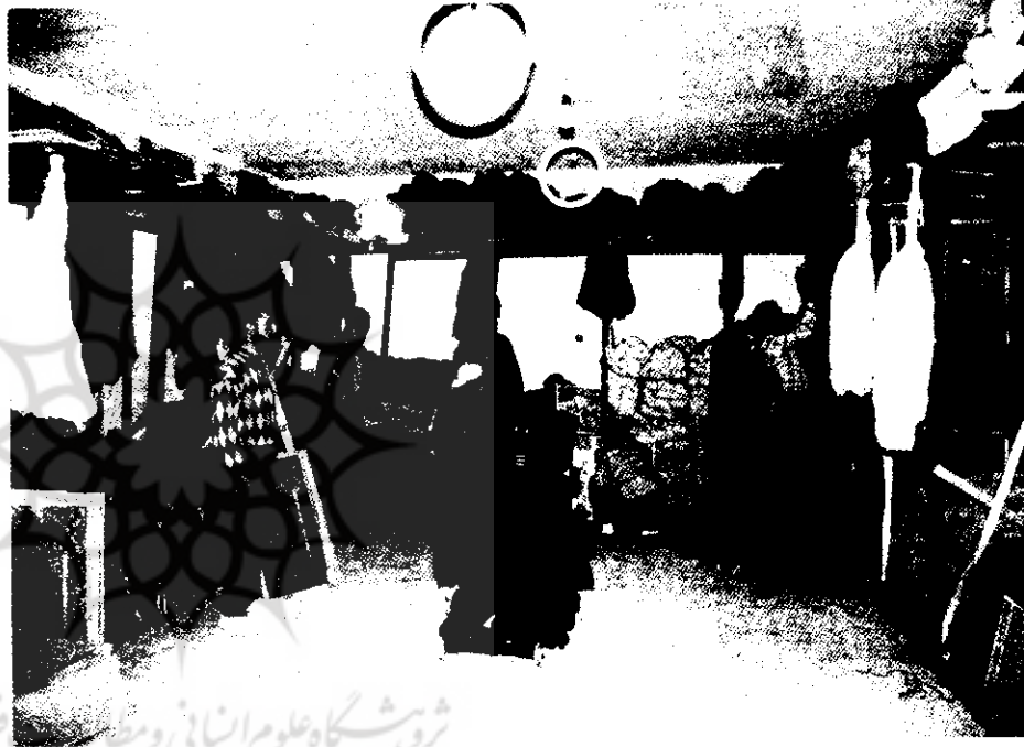
انبار مواد اولیه تعاونی فرش دستباف کرمانشاه

این شرکت تعاونی توانسته است در سال ۱۳۷۱، هفتاد و پنج هزار متر مربع فرش به ارزش شش میلیارد و هفتصد و پنجاه میلیون ریال تولید نماید و در همین سال نیز با استفاده