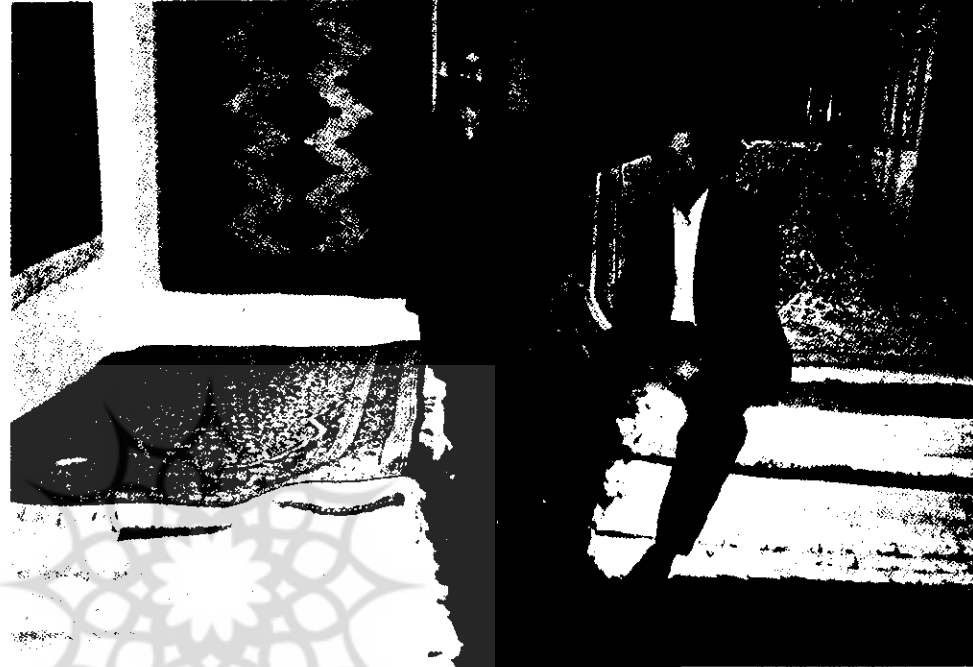
دفتر نمایندگی شرکت تعاونی در شهر کلن - آلمان

بزرگترین مشکل تعاونی ها تأمین منابع اعتباری است زیرا پیچیدگی مقررات باعث شده است که تعاونیها قادر به جذب اعتبارات نباشند و از سوی دیگر تهیه وثیقه ای را که