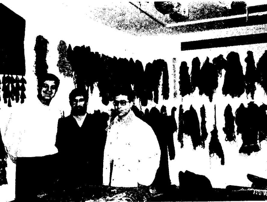
کارگاه تعمیر فرش تعاونی در شهر کلن - آلمان