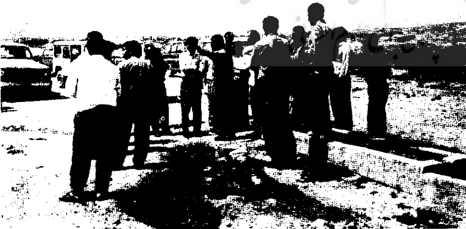
کارشناسان امور عشایری در حال بازدید از یک تعاونی