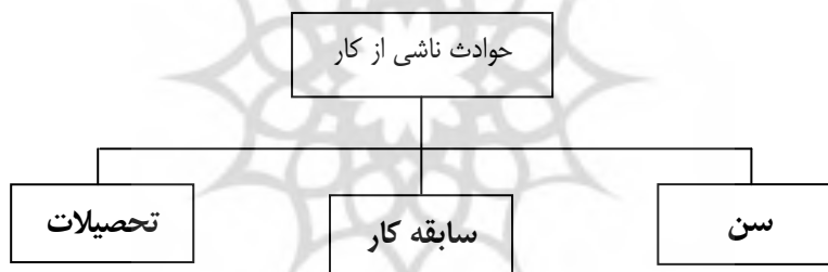
شکل شماره (۲): نمودار درخت سلسله مراتبی

اولین مرحله از AHP، توسعه یک ساختار سلسله مراتبی برای ارزیابی مسأله می‌باشد. بر اساس اصل ترسیم درخت سلسله مراتبی، درک یک مسأله در حالت کلی و پیچیده برای انسان کاری دشوار است و ممکن است ابعاد مختلف و مهم مسأله‌ی مورد نظر، مورد توجه قرار نگیرد. از این رو تجزیه یک مسئله کلی، به چندین مسأله‌ی جزئی‌تر در درک مسأله بسیار کارساز می‌باشد. در این مقاله، اولین سطح از این درخت سلسله مراتبی، "حوادث ناشی از کار" است و در سطح دوم آن، سه معیاری قرار دارند که بر حوادث ناشی از کار اثر می‌گذارد. این معیارها عبارتند از: (شکل ۲)