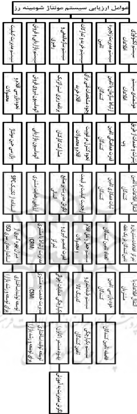
شکل شماره (۱): عوامل اصلی و فرعی ارزیابی تولید ناب