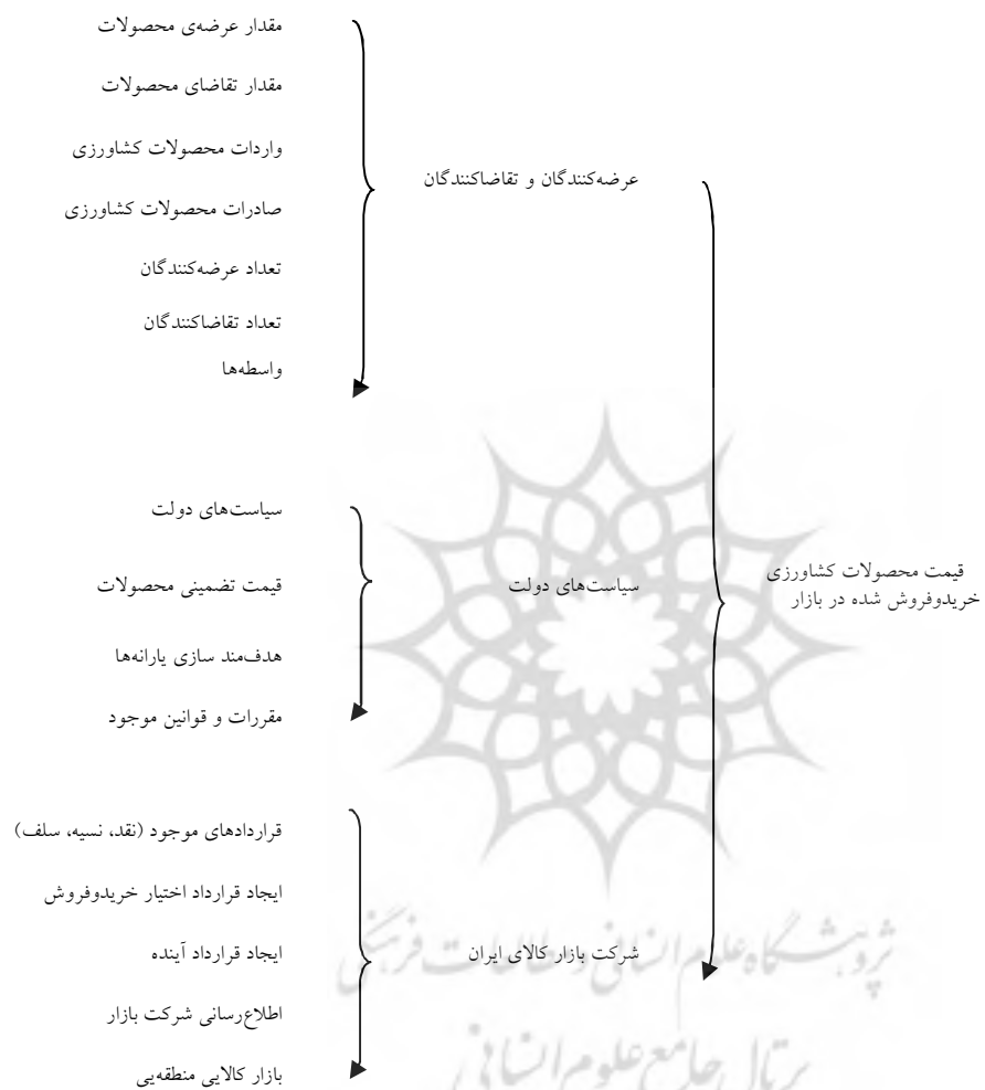
نگاره‌ی (۳). عوامل موثر بر قیمت محصولات کشاورزی بازار کالای ایران

دانشگاه و کارشناسان اقتصادی بازار) و سه کارگزاری فعال بازار مراجعه گردید. در نهایت سه بخش عرضه‌کنندگان و تقاضاکنندگان، دولت و شرکت بازار کالای ایران به عنوان بخش‌های موثر بر قیمت تعیین شده در بازار کالای ایران برای محصولات مشخص شد، که هر کدام متغیرهای خود را دارد. شکل ۳ بخش‌ها و متغیرهای هر کدام را نشان می‌دهد.