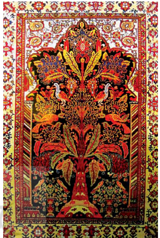
تصویر ۱۴- قالی ساروق- فراهان، اواخر ۱۳ ه. ق، ۲۰۲×۱۳۶ سانتی متر

در این نمونه یکی از کهن‌ترین سنت‌های تصویرگری درخت‌زندگی وجود دارد که نشانه‌های دالبری به زیبایی بر فراز هم قرار گرفته‌اند و درخت سرو به شکل نمادین و تقریباً واقع‌گرایانه طراحی شده، اما هندسی نیست. از طرفی درخت در میان محراب قرار دارد و حضور درخت در محراب، یکی از دلایلی است که می‌توان آن را درخت‌زندگی نامید. در این پارچه، درخت سرو در راس کوه قرار دارد. طاووس‌ها و درختان دو طرف آن را احاطه کرده و در پایین صحنه جهش شیر بر گرده آهو نقش‌پردازی شده که این نقشمایه نمادین خود تاکیدی است بر لحظه رویش حیات گیاهی و مفهوم برکت، باروری و فراوانی (عابد دوست، ۱۳۹۰، ۳۱۴)