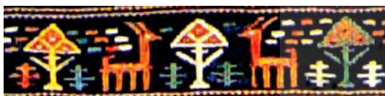
تصویر ۱۷ ب