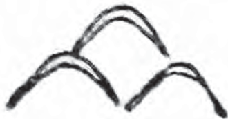
تصویر ۱- نماد کوه در خط ابتدایی ایلامی

کوه و سنگ، یکی از کهن‌ترین اجزای صحنه‌های مقدس