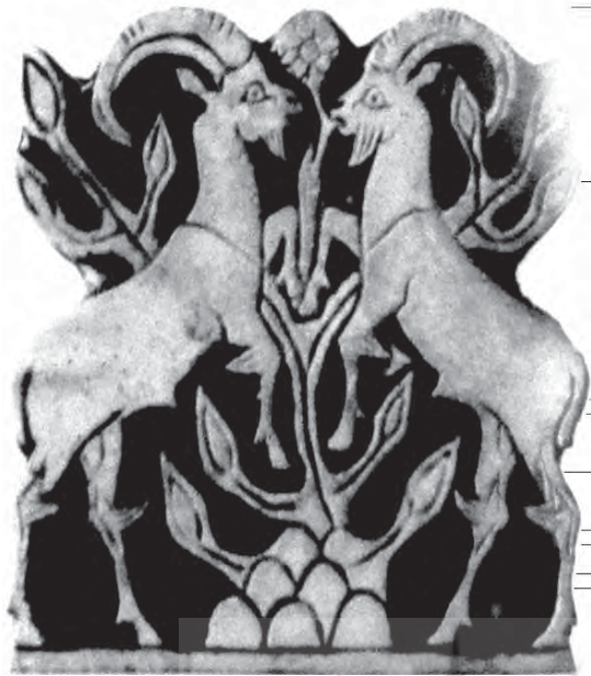
تصویر ۴ - صفحه حکاکی شده از سلسله اور