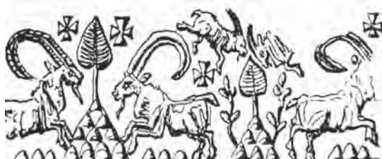
تصویر ۲- درخت سرو میانی بر روی کوه، مهری از شوش، هزاره سوم ق.م، ماخذ: پوپ، ۱۳۸۷، ۳۶۷

است. روایت‌های اسطوره‌ای و به‌ویژه اسطوره‌های ایرانی نشان می‌دهند که پیوند درخت مقدس، درخت زندگی و درخت کیهانی با سنگ یا کوه مقدس، یک کهن‌الگوی شناخته شده در بین ملل مختلف است. «کهن‌ترین مکان مقدس که می‌شناسیم جزئی از عالم صغیر است یعنی منظری از سنگ و آب و درخت». (الیاده، ۱۳۸۵، ۲۶۳) الیاده از این پیوند به‌عنوان مرکز توتمی یاد می‌کند. «پیوند درخت، سنگ-کوه و آب سه جزء منظره مقدس‌اند. این سه عنصر مهم، به‌طور گسترده‌ای با ایزدانوی بزرگ مربوط بود، درخت زندگی، آب زندگی و ستون مقدس. این سه جنبه در گستره وسیع خاورمیانه کهن، مصر و شرق مدیترانه گسترش یافته بود». (James, 1966, 33) ارتباط ایزد بانوی بزرگ به‌عنوان منشاء آفرینش و نماد باروری با آب‌های مقدس و درخت زندگی و سنگ یا کوه مقدس نیز دیده می‌شود. «در ایران خدا بانو، آردویسور آناهیتا، آب‌های توانمند بی‌آلایش، خاستگاه همه آب‌های روی زمین است» (هینلز، ۱۳۸۵، ۷۹) و دریای فراخکرد مرکز این آب‌ها، مرتبط با درخت بس تخمه و درخت گوگرد درخت زندگی است.