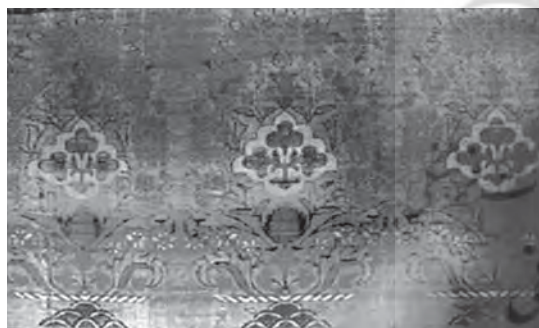
تصویر ۸- شال ابریشمی، سده ۱۱ و ۱۲ ه.ق، ماخذ: بیکر، ۱۳۸۵، ۱۲۱