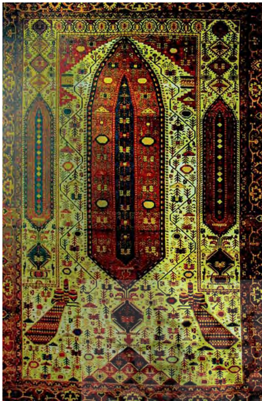
تصویر ۱۵- قالی ملایر، سده ۱۳ ه. ش.