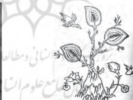
تصویر ۷- پارچه ایرانی، سده ۱۱ ه.ق بافت مشهد

داشته و هنرمندان در دوره ساسانی این نقشمایه‌ها را به‌طور آگاهانه و همراه با مفهوم نمادین آن به‌تصویر کشیده‌اند. پس قبل از دوره اسلامی این نقشمایه به‌شکلی به‌کار رفته که زمینه‌های فرهنگی و دینی آن در جامعه وجود داشته است.