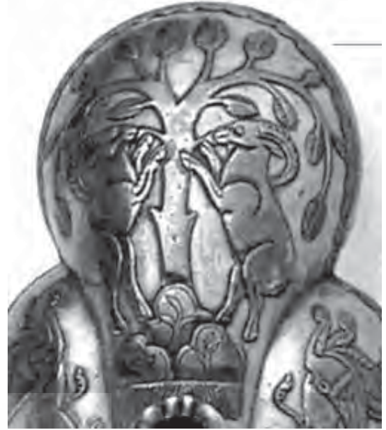
تصویر ۳ - ظرف ساسانی

ایران، از کهن‌ترین ایام پی‌گیری کرد. هر تسفلد نشانه‌های پولک مانند را که بر روی هم قرار گرفته‌اند، در خط ابتدایی ایلامی نشانه کوه می‌داند. (هر تسفلد، ۱۳۸۱، ۴۳) (تصویر ۱) این نشانه‌های تصویری که نشان دهنده کوه هستند، در آثار هنری دوره‌های مختلف همراه با درخت و محافظان اسطوره‌ای تکرار می‌شوند، مانند آنچه در مهر ایلامی به چشم می‌خورد. به نظر اکرمین «درختی از تیره مخروطی برگریز که بر روی کوهی قرار دارد، نماینده ماهدرخت است» (پوپ، ۱۳۸۷، ۳۱۲۴) ماهدرخت خود شکلی از درخت زندگی است که منشأ حیات و همراه با مفهوم برکت و باروری است.