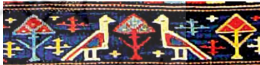
تصویر ۱۷ الف

تصویری کهن و تداوم حیات نشانه‌های تصویری کوه و درخت به خوبی آشکار است.