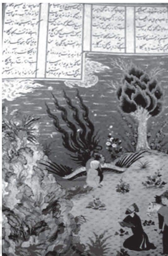
تصویر ۵- درخت بر فراز تپه، شاهنامه، مکتب هرات، حدود ۸۴۴ ه.ق، ماخذ: پوپ، ۱۳۸۷