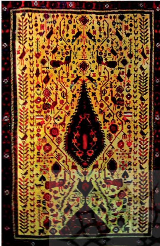
تصویر ۱۰- قالی افشار، شهر بابک، سده ۱۳ ه.ش