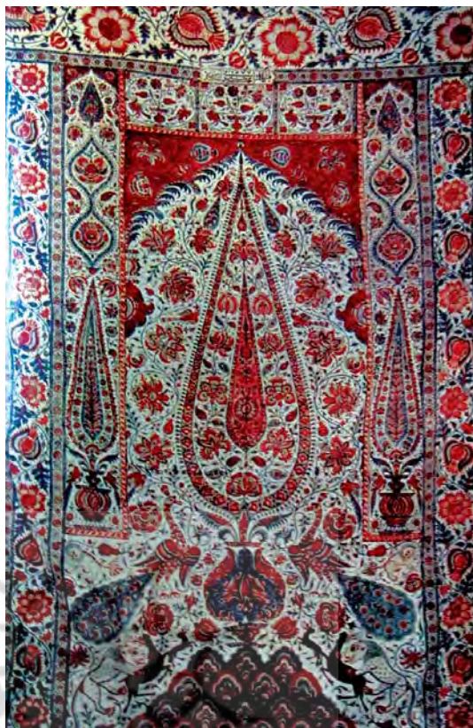
تصویر ۱۲- پارچه قلم‌کار بروجن، ۱۳۷۷ ه.ش، ۱۱۴×۱۷۱ سانتی‌متر