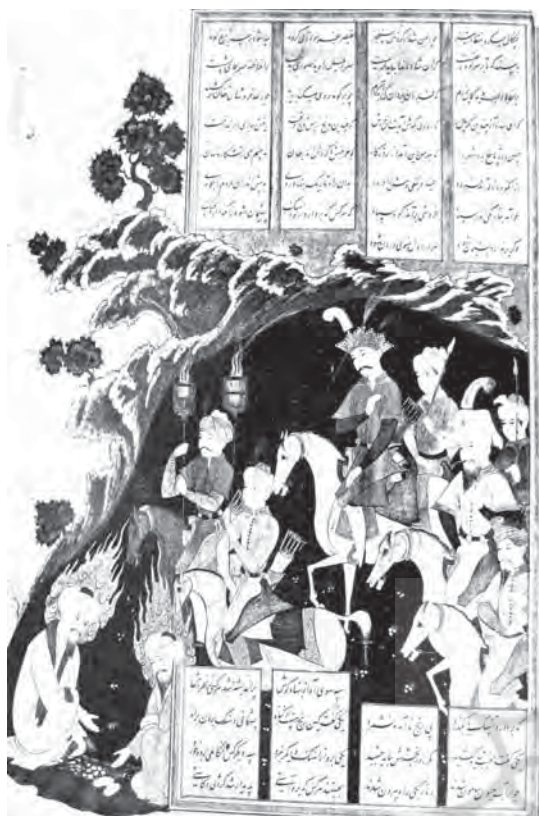
تصویر ۶- شاهنامه اصفهان سده ۱۱ه.ق

تداوم حیات نماد کوه و درخت در هنر تصویری کهن ایران و نمود آن بر فرش‌های معاصر ایرانی