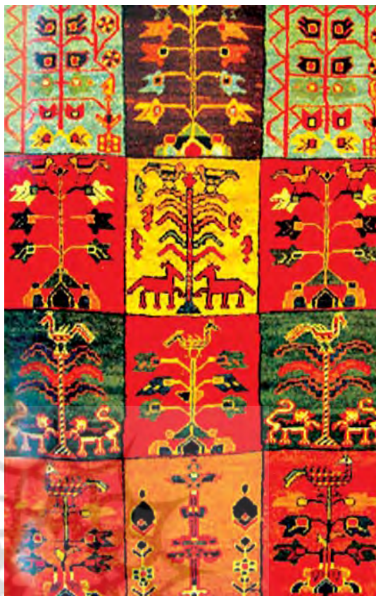
تصویر ۱۶ - قالی چهارمحال و بختیاری، طرح خشتی، اواخر سده سیزده ه.ش ماخذ: Opic, 1998, 146