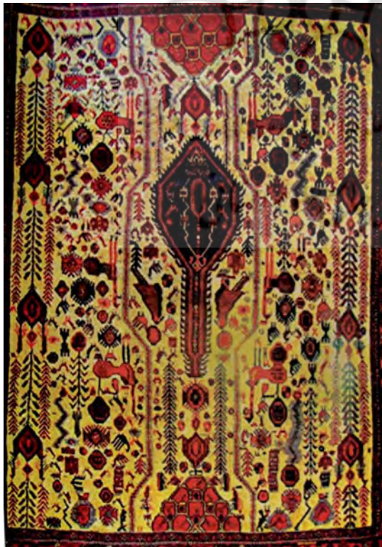
تصویر ۱۱- قالی شهر بابک، ۱۳۳۹، ۱۶۸×۲۰۵ سانتی متر

می‌شود. (کاظم پور، ۱۳۸۹، ۹۱) در نگاره‌ای از شاهنامه مکتب هرات حدود ۸۴۴ ه.ق، سیمرغ زال را برای پدرش سام باز می‌آورد، در این نگاره درخت بر صخره‌ای قرار گرفته است. (پوپ، ۱۳۸۷، لوح ۸۷۶) (تصویر ۵) به همین ترتیب در شاهنامه متعلق به مکتب اصفهان، نیمه سده ۱۱ ه.ق در صحنه دیدار اسکندر، خضر و الیاس بر آب حیات، رقم معین مصور، تک درخت بر بالای صخره سنگی قرار گرفته است.