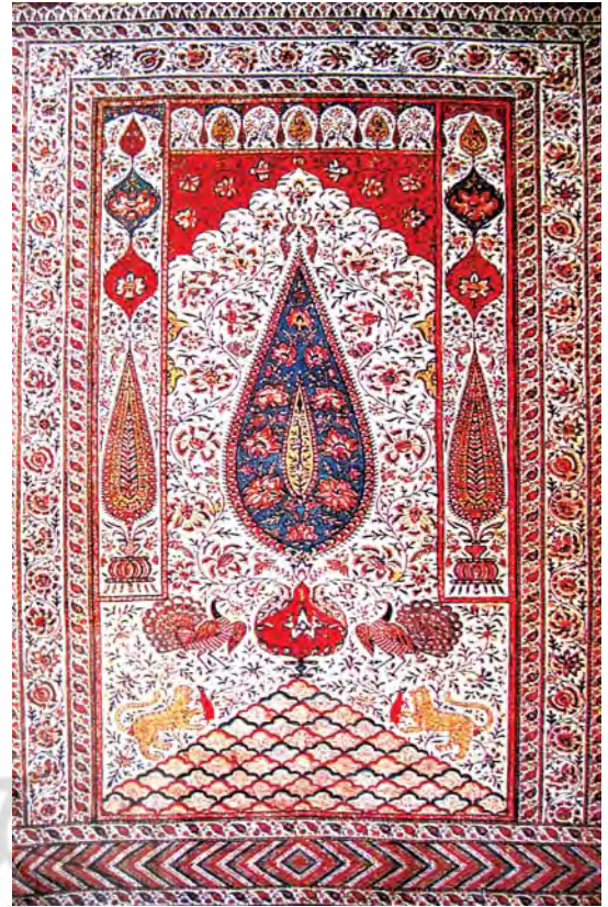
تصویر ۹- آویز چاپی، کتان، نیمه دوم سده سیزدهم ه.ق، ماخذ: همان، ۱۴۷