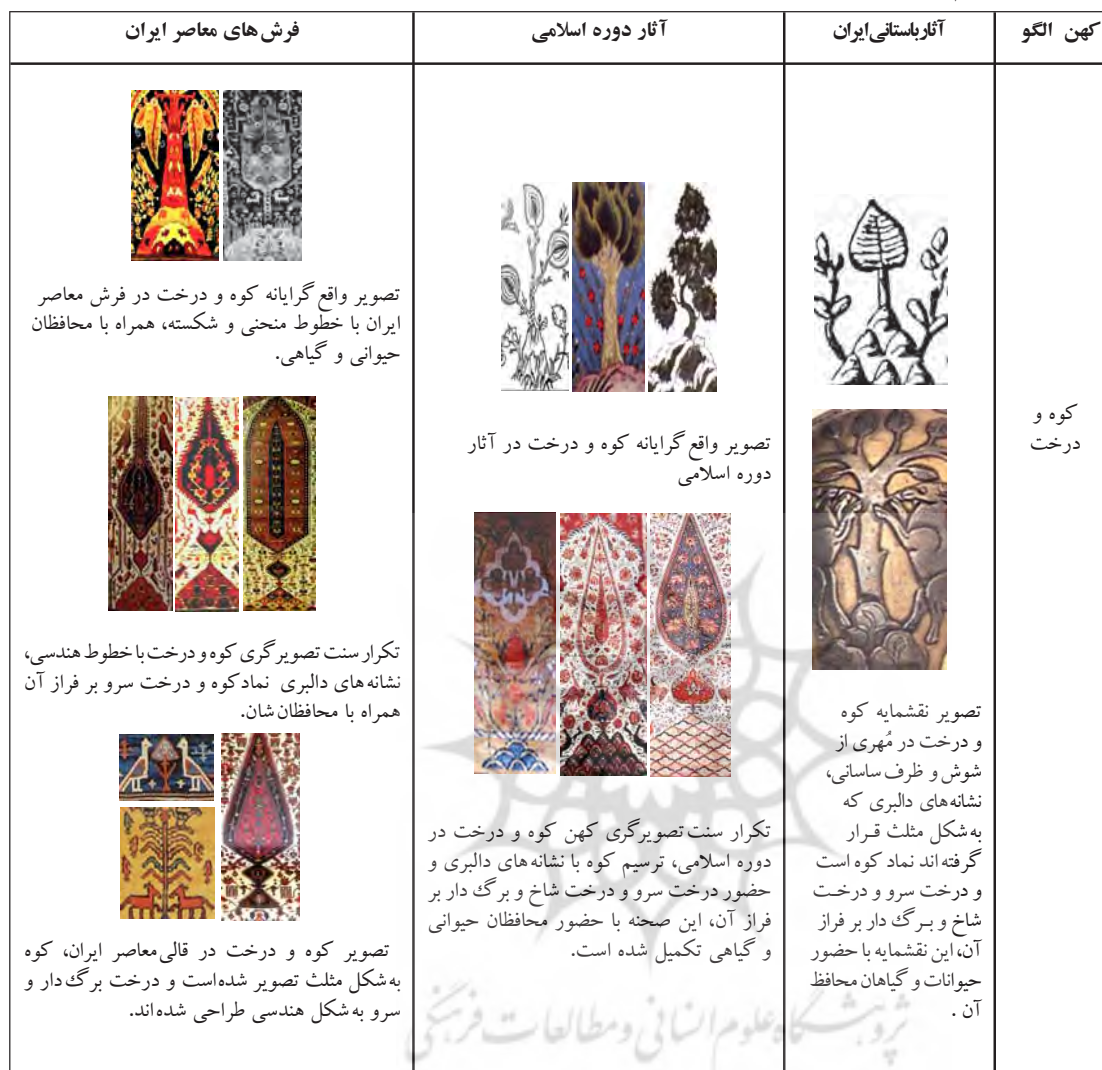
جدول ۲- تداوم حیات نمادکوه و درخت در هنر تصویری کهن ایران و نمود آن بر فرش‌های معاصر ایرانی

شاخ و برگ‌دار و گاه به شکل واقع‌گرایانه طراحی شده و در مواردی نیز شکل هندسی دارد. کوه نیز اغلب به صورت یک مثلث و بیش‌تر به شکل مثلثی متشکل از آرایه‌های دالبری شکل دیده می‌شود. این ترکیب در اغلب موارد همراه با گیاهان و حیوانات محافظ است. می‌توان این مجموعه نمادها در فرش‌های معاصر ایران را از نظر تصویری با نمونه‌های کهن آن در تاریخ هنر تصویری ایران مقایسه کرد و آن را تداوم یک سنت تصویری دانست. این نمادها علاوه بر صورت ظاهری که نوعی برداشت انتزاعی از طبیعت است، از مفاهیم نمادین نیز برخوردارند بررسی اسطوره‌های ایرانی نشان می‌دهد در پس این ارتباط نمادین، مفهوم فلسفی دینی، باروری، برکت و حیات بخشی نهفته است. بدین سان اسطوره‌ها از درخت زندگی یاد می‌کنند که میوه آن باعث حیات جاوید می‌شود و درخت کیهانی رابط میان آسمان و زمین است و به عنوان مرکز جهان، سرچشمه حیات و زندگی است. این دو درخت مقدس بر روی کوه مقدس نیز توصیف شده‌اند. این موضوع نشان می‌دهد نقشمایه درخت و کوه که از دوره ایلامی در آثار هنری ایران به چشم می‌خورد، در دوره اسلامی نیز ادامه داشته و نمونه‌های زیبایی از آن بر روی فرش‌های معاصر ایرانی دیده می‌شود. دو نماد کوه و درخت، بیان‌گر مفاهیم مقدسی‌اند که برکت، باروری و