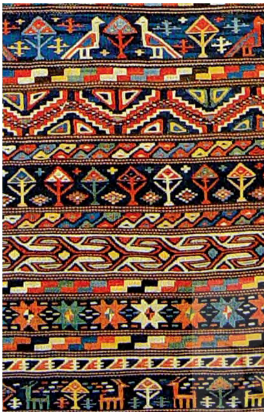
تصویر ۱۷ - گلیم کرد کوچان، اواخر سده ۱۳ ه.ش، ماخذ: همان، ۱۶۷

تداوم حیات نماد کوه و درخت در هنر تصویری کهن ایران و نمود آن بر فرش‌های معاصر ایرانی