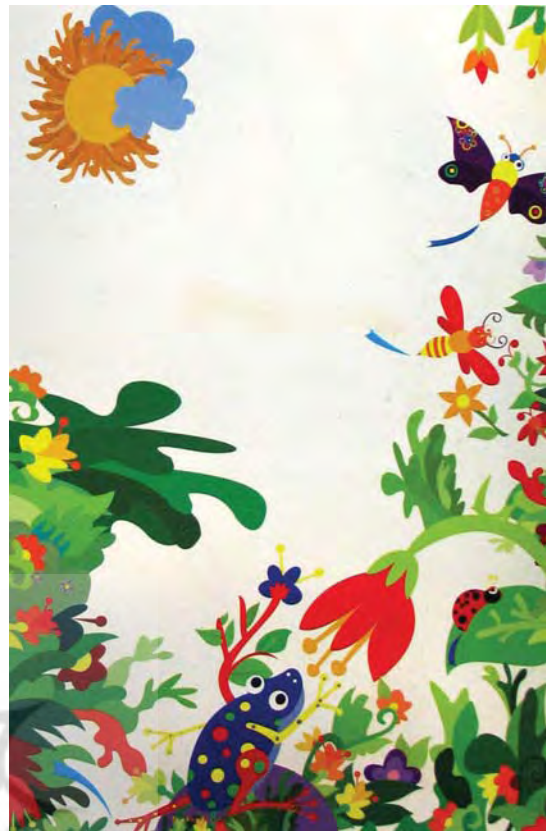
تصویر ۳- شکوفه ها، مریم توحیدی، کتاب سال تصویرگران، ۱۳۸۵

در تصویرگری کتاب های داستانی کودکان، طبیعت گیاهی از جمله درختان و گل ها، شاخص ترین عناصری هستند که برای فضا سازی داستان کاربردهای متفاوتی دارند. در این گونه تصاویر، طبیعت علاوه بر این که نشان دهنده موقعیت مکانی و زمانی داستان است، می تواند جنبه های