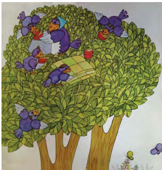
تصویر ۱- قصه الاغه و کلاغه، آزاده افراسیابی، ۱۳۸۵

موضوع مطرح این است که طبیعت چه جنبه های بیانی و