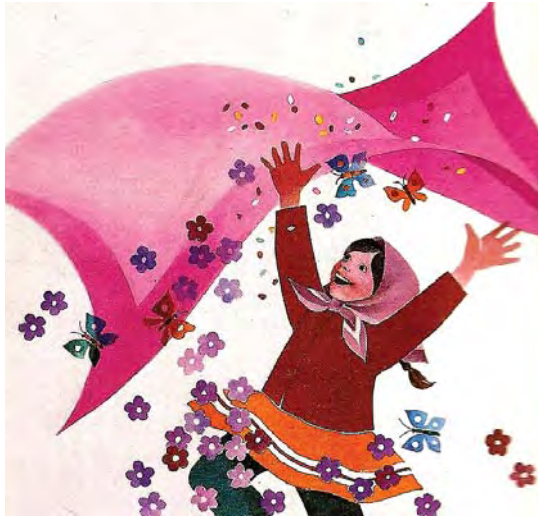
تصویر ۹- یک مشت نقل رنگی، نیره تقوی