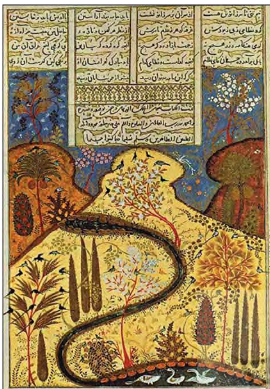
تصویر ۷- کوه و جویبار، گلچین بهبان