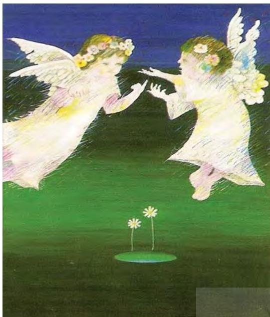
تصویر ۱۹- جهان مقدس، محمدرضا دادگر