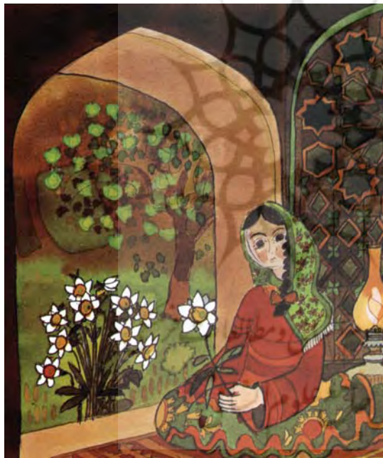
تصویر ۵- دخترک و گل نرگس، آلن بایاش، ۱۳۷۲

آزاد، تصویرگر با رفتاری آزادتر و گسترده تر، پس زمینه کنش های تصویری قهرمانان خود را به نمایش می گذارد و با بهره جویی از نشانه های معماری یا عناصر طبیعی هم چون درخت ها، کوه ها و دشت ها، پس زمینه های مورد نظر خود را فراهم می سازد». (اکرمی، ۱۳۸۷، ۶۹)