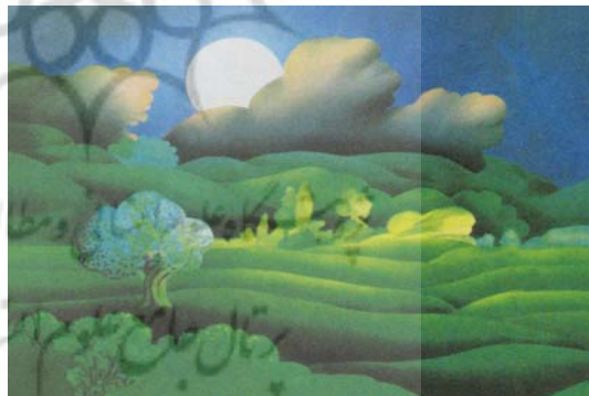
تصویر ۱۳- یک حرف و دو حرف، محمدرضا دادگر، ۱۳۶۵