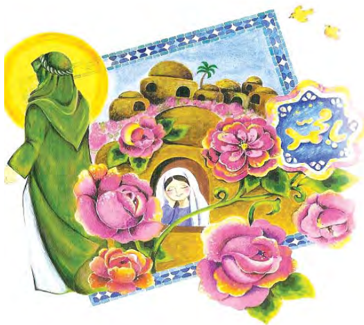
تصویر ۱۷- پیامبر عزیز ما، فرانک ثمری، ماخذ: همان