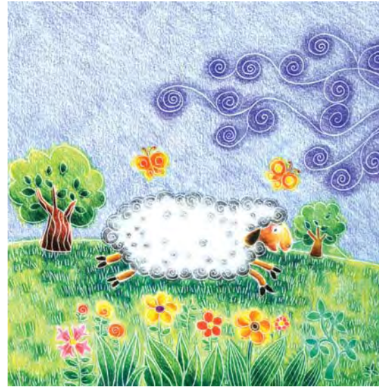
تصویر ۷- دو لقمه چرب و نرم، شهرزاد شوشتریان کتاب سال تصویرگران، ۱۳۸۴