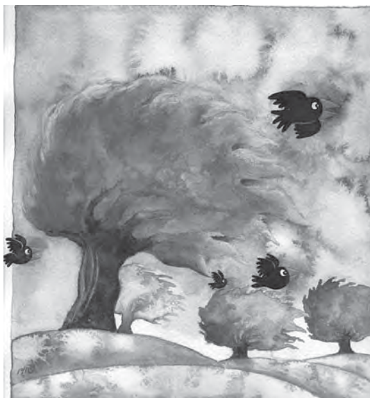
تصویر ۲۲- پاییز، محسن حسن پور، ۱۳۸۰