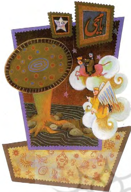
تصویر ۱۶- معراج، داریا پترلی، ماخذ: همان