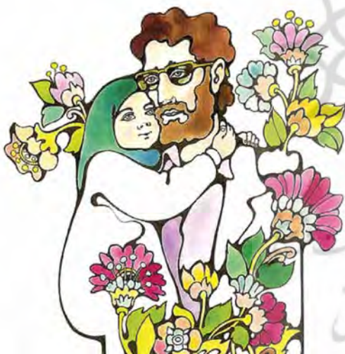
تصویر ۲۰- مثل چشم های بابا، پرویز اقبالی، ۱۳۷۵