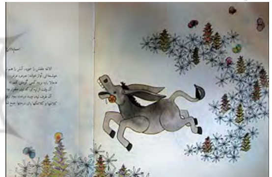
تصویر ۸- قصه الاغه و کلاغه، آزاده افراسیابی، ۱۳۸۵

رنگ‌های حاکم بر تصویر، حسی از فضای قدیمی و سنتی را القاء می‌نمایند.