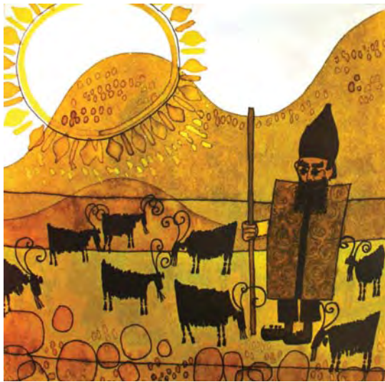
تصویر ۴- چوپان دریایی، آلن بایاش، ۱۳۵۴