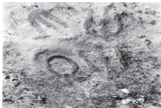
تصویر ۵- چهار حرف یا اوجاق از یئنگی اورخون