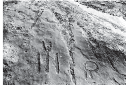
تصویر ۳- انتخاب وحک سه حرف از اورخون، طایفه کشی گولی برای اوجاق یک قوم

ترجمه: دخترم، دختر مادر/ دخترم را می دهم به «اوزان»/ اوزان پول به دست می آورد/ دخترم بپوشد و خود را بیاراید. در این جا اوزان به معنی افسانه سرا، شاعر ساز زن خلق به کار می رود». (بهزادی، ۱۳۶۹، ۲۱۶)