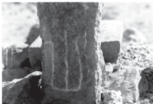
تصویر ۸- اوجاق ایل نفران ایل اویسرات ۱۱۴ ایسل‌های قشقایی حرف (نی) از ینگی اورخون واقع در بابانجم اویغور