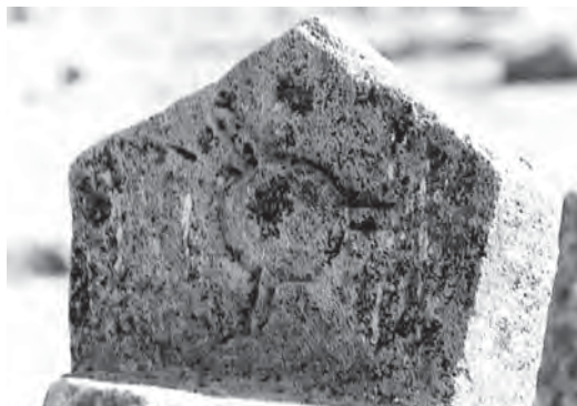
تصویر ۷- نمایی کلی و رنگ‌شده قبيله اويرات يا اوريات از ایل‌های قشقایی

بزرگ ترک هاست داستان‌های کتاب ده ده قورقوت که مشهورترین ترین کتاب افسانه در زبان ترکی است که بر پایه اساطیر و تاریخ اوغوزها سروده شده است. افسانه‌های ایل قشقایی عبارتند از: افسانه اوغوز، مهرخاور (سوریاینن مهرشاد) کور اوغلو، کرم اصلی، هوسوب قوربان (یوسف قربان)، غریب و صنم، آخساق جیران (آهوی لنگ)، محمودونگار، سایاتنن همراه (سایات و همراه) قیرات، شاه برخوردار حاتم طایی، صیدی خان و پریزاد، ملک محمد شاه، یان اقول (پسر نصفه) شیرزاد پهلوان گرایلی و غیره.