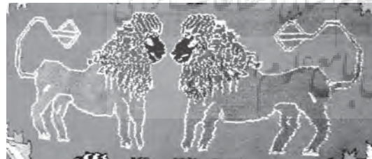
تصویر ۲۱- قالی با نقش شیر

عناصر به کار رفته در این داستان عبارتند از بوزقورد (گرگ خاکستری) تیر و کمان، سه تیر نقره، عدد بیست و چهار که نماد قبایل بیست و چهارگانه اوغوز است، در میان دست بافت های ایل قشقایی نمونه هایی وجود دارد که از افسانه اوغوز الهام گرفته شده است. (تصویر ۱۹ تا ۱۷)