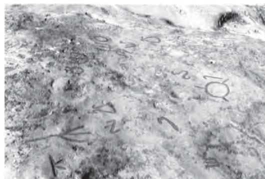
تصویر ۶- نمایی کلی و رنگ شده «ایل اوجاقی قیشلاق» حروفی از الفبای یئنگی اورخون