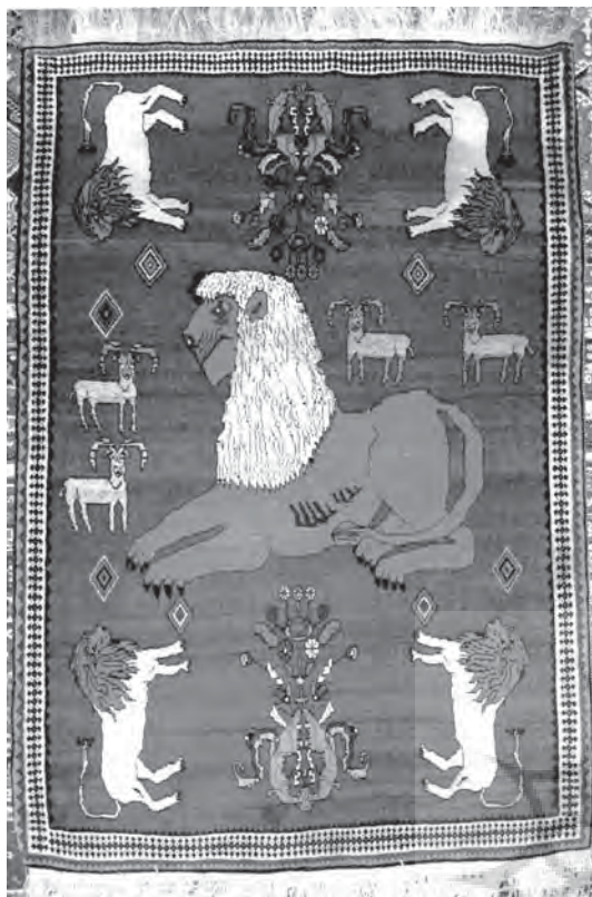
تصویر ۲۳- قالی با نقش شیر

اصلی در افسانه کرم واصلی، و سوری در افسانه مهر خاور. این نقش با نام این شخصیت‌ها در بین بافندگان ایل شهرت دارد. (تصویر ۱۸)