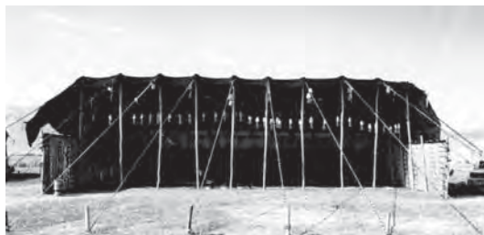
تصویر ۱- نمای بیرونی سیاه چادر ایل قشقایی

ارائه دلایل و مدارک متقن و صحیح به آن اشاره می‌کند. وی معتقد است قشقایی‌ها یکی از طوایف بیست و چهارگانه ترکان اوغوز به نام قائی هستند و قسمتی از قائی‌ها که در منطقه کش (kash) در ماوراءالنهر سکونت داشتند، بعداً تحت شرایط سخت طبیعی و سیاسی قرار گرفته و به سمت شمال ایران و آذربایجان کوچ کردند و مدت‌ها در آن مناطق زندگی کردند تا این که حدود ده قرن قبل به جنوب و مرکز ایران رانده شدند». (کیانی، ۱۳۸۵، ۱۶)