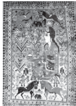
تصویر ۲۰- قالی با تصویری که به نام اصلی صنم ویا سوریا

تصویر ۱۶- درنا در حال نشست و پرواز کردن « \text{X} » نشانه قبیله قایی - قشقایی