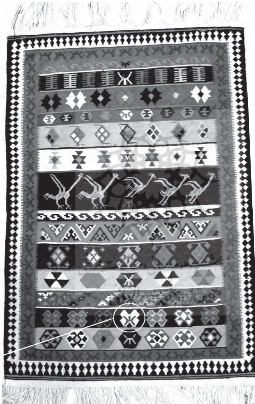
در نادر حال نشستن و پرواز «X» نشانه قبیله قایی - قشقایی