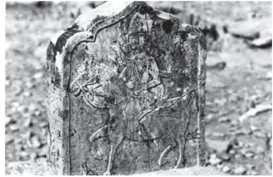
تصویر ۱۱- نمایی از سر قبر ویژه قشقای ها، اسب سوار مسلح به تفنگ وشمشیر در قبرستان بابانجم ایغور