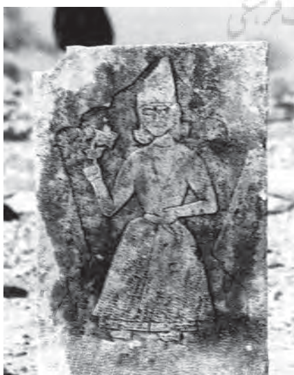
تصویر ۱۰- کلاه، شمال و آرخالوق مرد قشقایی که شاخه‌ای گل بر دست دارد، مربوط به زمان قاجاریه و حکومت فرمانفرما در فارس، نشان صلح و آشتی»

ایل قشقایی گویش ترکی دارند و زبان ترکی از زبان‌های التصاقی است، در این زبان کلمات معمولاً دارای یک ریشه ثابت و غیر قابل تغییرند و برای ساختن واژه‌های جدید، پسوند یا پیشوند به ریشه اصلی کلمه افزوده می‌شود. در این زبان‌ها فعل بدون قاعده وجود ندارد. زبان‌های اقوام قدیم دنیا مانند: سومری‌ها، ایلامی‌ها، هیت‌ها، کاسی‌ها، هوری‌ها (میتانسی‌ها = مادها)، قوتی‌ها (کوتی‌ها) لولوبی‌ها (لولوها)، اورارتو‌ها و غیره جزء زبان‌های التصاقی است. امروزه هم زبان‌های کره‌ای، فنلاندی، ترکی منچوری، مغولی، ژاپنی و غیره از گروه این زبان‌ها (التصاقی) محسوب می‌گردد. اولین افسانه‌ای که در میان تمام ترک زبان‌ها، از جمله ایل قشقایی رایج است «افسانه اوغوز نام دارد، اوغوز نام شخص و نام ایل