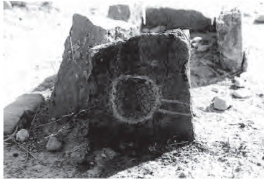
تصویر ۴- تیره سهمدینلی