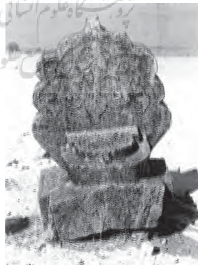
تصویر ۹- نمای عمودی و داخلی قبر (احتمالاً متعلق به زنان قشقایی) با نقشی از قالی