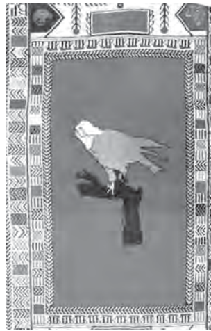
تصویر ۱۸- قالی با نقش عقاب