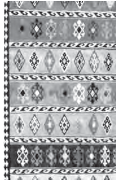
تصویر شماره ۱۲- گلیم بانقش دوناییگی وخراسانی