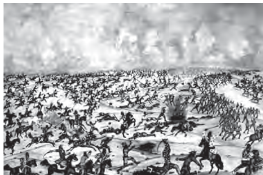
تصویر ۱۳- جنگ ایل قشقایی با قشون انگلیس (بیژن بهادری کشکولی)

سینه به سینه با شعر و موسیقی حفظ شده و در نقاشی راه پیدا نکرده است». (بهادری کشکولی، ۱۳۸۷، مصاحبه ۱ (تصاویر ۱۳ تا ۱۵))