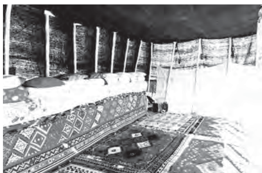
تصویر ۲- نمای داخل سیاه چادر ایل قشقایی