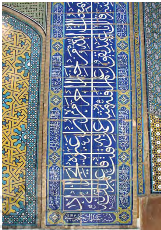
تصویر ۸- حرف « ی » معکوس، کُرسی کتیبه را به دو بخش بالا و پایین تقسیم کرده است. بخشی از کتیبه حاشیه ایوان اصلی مدرسه شاه سلطان حسین (مادر شاه) اصفهان.

یک کتیبه دخیل هستند، در بر می گیرد در نتیجه زیبایی کتیبه ها بستگی به ساختار منسجم و محکم آن ها دارد. در یک نگاه کلی کتیبه های ثلث این دوره از قدرت ترکیب بندی بالایی برخوردارند و همگونی و هماهنگی منطقی و معقولی مابین نوشته ها و نقوش تزئینی دیده