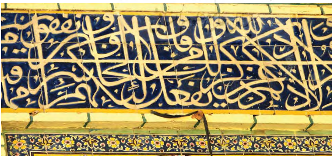
تصویر ۱۰- بخشی از کتیبه ایوان شمالی مسجد امام (شاه) بازار تهران. به خط محمد مهدی تهرانی ملقب به کاتب السلطان. دوره قاجار، ترکیب بسیار فشرده و تو در تورات نشان می دهد.

عناصر بصری اعم از شکل حروف، رنگ و نقوش تزئینی، همچنین قدرت ترکیب بندی و تناسب بین حرکات عمودی و افقی در سرتاسر کتیبه، به طوری که کل نوشته ها در هماهنگی کامل با همدیگر فضای چشم نوازی را القا نمایند. ساختار یا سازمان در واقع تمام عناصری را که در زیبایی