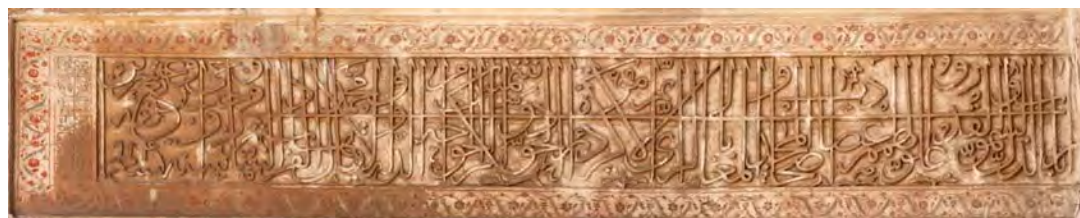
تصویر ۶- کتیبه گچی به روش بر جسته، ایوان ورودی مسجد سرخ سمنان

رنگ مهم ترین و اولین عنصر تجسمی است که به چشم بیننده می نشیند. معماری مذهبی صفوی سرشار از رنگ های جذاب است و از این بابت بسیار غنی می باشد.