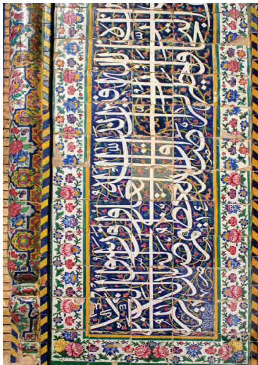
تصویر ۹- بخشی از کتیبه ایوان مسجد نصیر الملک شیراز، به خط عبدالعلی اشرف الایزدی، دوره قاجار، ( مأخذ عکس نگارنده ۱۳۸۶)