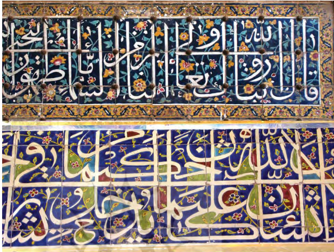
تصویر ۱۱ - دو نمونه از کتیبه های ثلث دوره قاجار با زمینه های رنگارنگ به روش هفت رنگ. بالا، سر در حمام ظهیر الدوله در کرمان، پایین، کتیبه گنبد خانه امام زاده زید در بازار تهران.

که یکی در میانه ۱/۲ پایین و دیگری در میانه ۱/۲ بالای کتیبه، معمولاً کشیده های معکوس این دو کرسی را تشدید می کنند. البته در خط ثلث، کلمات و حروف حالت سیالی دارند و چنانچه ضرورت داشته باشد می شود بدون در نظر گرفتن قاعده کلی کرسی بندی در جای مناسب قرار داد. (تصویر ۸)