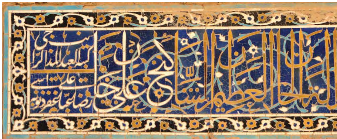
تصویر ۱- کتیبه ایوان ورودی کاروانسرا (مدرسه) گنجعلیخان در کرمان، به خط علیرضا عباسی، دوره صفوی (مأخذ عکس، نگارنده ۱۳۸۶)

می شود. در رساله آداب المشق، نسبت این گونه تعریف شده است: «اما نسبت و آن است که هر حرف را چنان نویسند که نسبت به قلم کوچک و بزرگ نباشد و چون این صفت در خط به فعل آید هر دو هیئت که مثل یکدیگر باشند کمال مشابَهت خواهند داشت و اگر خلاف این باشد مطبوع نخواهد بود». (میر عماد، ۱۳۷۱، ۹) چنانچه اگر یک چشم کوچک و چشم دیگر بزرگ تر باشد نامتناسب است. نخستین اصل تناسب در کتیبه نگاری، نسبت پهنای قلم به طول و عرض کتیبه می باشد. بر اساس این نسبت، خطاط می تواند یک متن را در طول و عرض تعیین شده بنویسد به نحوی که ابتدا و انتهای یک کتیبه از یکناختی و هم گونی یکسانی برخوردار باشد.