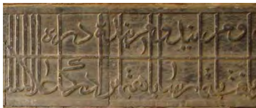
تصویر ۴- کتیبه سردر ایوان ورودی کاروانسرای نطنز، دوره صفوی، حجاری روی سنگ ( احتمالا به خط علیرضا عباسی است) حجاری روی سنگ

هر مصالحی دارای ویژگی های فنی، فیزیکی و شیمیایی است. این خواص هر کدام قابلیت ها خاصی دارند