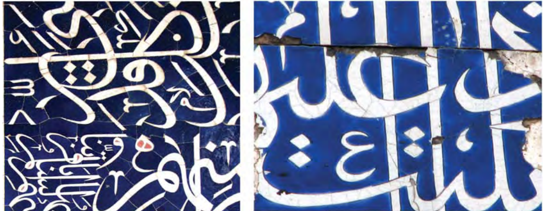
تصویر ۳- مقایسه دو روش کاشی کاری، سمت راست، کاشی هفت رنگ، بخشی از کتیبه ایوان مسجد و مدرسه شیخ عبدالحسین در بازار تهران، دوره قاجار، سمت چپ، کاشیکاری معرق، بخشی از کتیبه مسجد شیخ لطف الله اصفهان، دوره صفوی