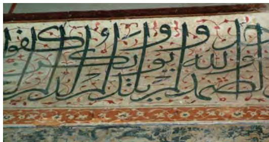
تصویر ۵- کتیبه گچی به روش تخمه در آوری، بقعه هارونیه در اصفهان، دوره صفوی، ( مأخذ عکس ، حجت الله امانی ۱۳۸۷)

برای نشان دادن دامنه استفاده از رنگ کافی است به دو بنای مشهور مسجد حضرت امام (ره) و مسجد شیخ لطف الله در میدان نقش جهان نظری بیافکنیم. از ابتدا تا انتها و از صدر تا ذیل این دو بنا پوشیده از کاشی های رنگارنگ است. این رنگ ها هم با محیط و هم با سایر رنگ ها، هماهنگی کاملی دارند و علاوه بر این نیز در جزئیات و کلیات، ارزش رنگی و هماهنگی شان حفظ شده است .