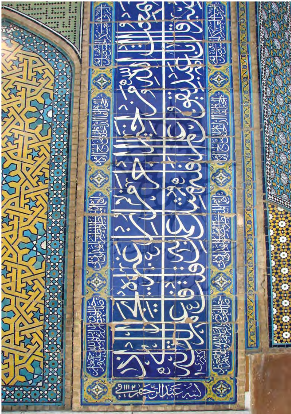
بخشی از کتیبه حاشیه ایوان اصلی مدرسه شاه سلطان حسین (مادر شاه) اصفهان.