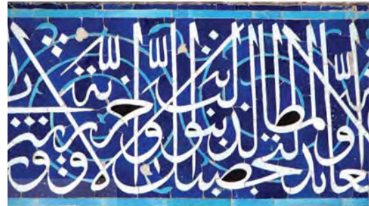
تصویر ۷- مقایسه دو نوع ترکیب بندی کتیبه های ثلث دوره صفوی، بالا بخشی از کتیبه مسجد شاه اصفهان. پایین، بخشی از کتیبه مسجد جامع اصفهان

که تاثیر زیادی در اجرا و در ظاهر و سیمای اثر هنری می گذارند.