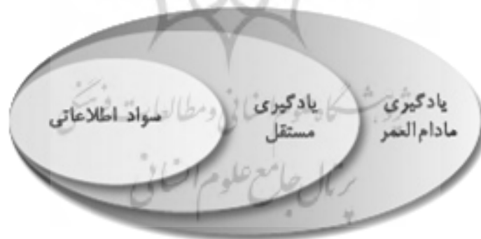
نمودار ۱. رابطه سواد اطلاعاتی، یادگیری مستقل و یادگیری مادام‌العمر

اندرتا ۸ (۲۰۰۴) نیز این مطلب را تأیید می‌کند و معتقد است که مهارت‌های سواد اطلاعاتی باید زیربنای یادگیری الکترونیکی باشد تا یادگیری مستقل را بنیان نهاده و دانشجویان را به یادگیری مادام‌العمر علاقه‌مند کند و آنها را برای اتخاذ تصمیمات آگاهانه آماده نماید تا از عهده سنگینی بار اطلاعات برآیند. بدون مهارت‌های سواد اطلاعاتی، افزایش و گسترش سریع اطلاعات و منابع بار سنگینی است که می‌تواند به تنفر و بی‌زاری فراگیران منتهی شود (نمودار ۱).