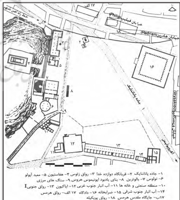
تصویر ۳. پلان آگورا در دوره کلاسیک (قرون ۴ و ۵ ق.م). [Camp, Lang, 2004: 4]. 2003: 3 و موریس، ۱۳۷۳: ۵۱. Fig.3. Model of the Agora in 400 B.C from the southeast wing.