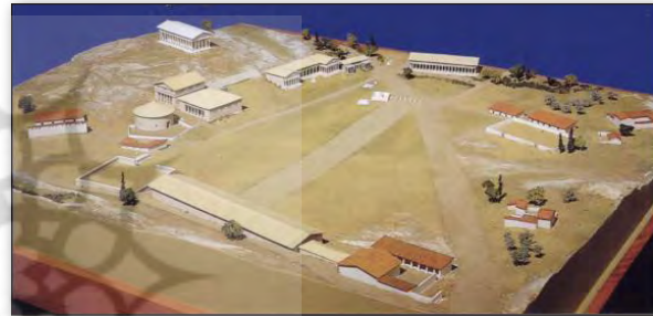
تصویر ۲. مدل آگورا در ۴۰۰ ق.م از ضلع جنوب شرقی. Fig. 2. Model of the Agora in 400 B.C from the southeast wing.

از آنجایی که دوره کلاسیک از مهم‌ترین ادوار استفاده از این فضای بسیار کلیدی در آتن است، در ادامه به توصیف بناهای این دوره بر پیرامون آن (تصویر ۲ و ۳) پرداخته شده است.