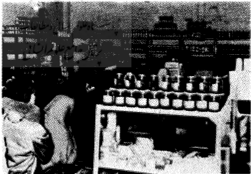
لطفاً " ورق بزنید

ضمناً این تعاونی در جهت تاسیس اتحادیه بازرگانی شرکت های تعاونی مصرف فرهنگیان کشور فعالیت موثر داشته و امیدواریم که هر چه زودتر این اتحادیه ، بتواند نیازهای عمده تعاونی های مصرف فرهنگیان کشور را برآورده نماید . در نتیجه این تعاونی با داشتن بیش از ۱۱۰ هزار نفر عضو که با احتساب خانواده های آنان حدود ۵۵۰ هزار نفر را تحت پوشش دارد . در حال حاضر بزرگترین شرکت تعاونی مصرف در سراسر کشور می باشد و در طول جنگ تحمیلی و تنگناهای ناشی از آن با وجود مشکلات عدیده که ذکر آن رفت ، نقش عمده در تامین نیازهای فرهنگیان محترم و تعدیل قیمت ها و گوناگون کردن دست واسطه ها داشته و بازویی برای دولت جهت توزیع عادلانه کالاها می باشد و امیدوار است در آینده نیز بتواند در جهت اهداف عالی تعاون قدم برداشته و تعاونیها نقش عمده ای در برنامه بازسازی کشور داشته باشند . یقین دارد با لطف خداوند و عنایت خاصی که مسئولان جمهوری اسلامی به بخش تعاون دارند ، رسالت تعاونیها حساس تر و نقش آنان در اقتصاد کشور روز به روز پویاتر گردد .