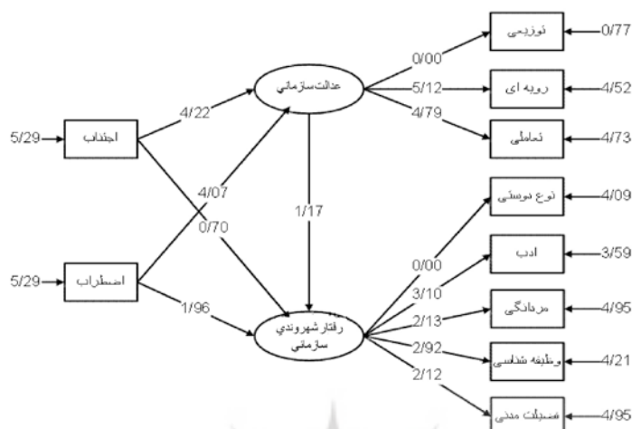
شکل ۲. مدل نهایی رابطه بین متغیرهای پژوهش