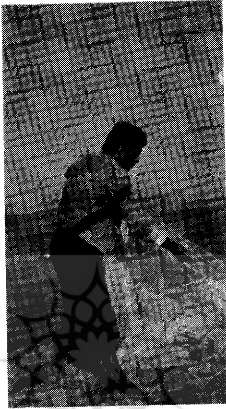
را نخواهند پیمود. پیشنهادات صیادان

بود. این موضوع مخصوصاً از این جهت قابللاحظه است که پراکندگی اداری شرکتهای تعاونی و وابستگی این مؤسسات به سازمانهای خصوصی نظیر شیلات، نه فقط کمکی به بود کفایت آنها نمیکند بلکه آنها را از سرویس ای آموزشی، حسابرسی، حقوقی و نظارتی گانهای تعاونی نیز محروم میسازد. بر این اساس قابل درک است که اگر هر چند سال بگر شرکتهای تعاونی صیادی وابسته به شیلات باقی بمانند، حداقل بدلیل عدم برهه این ارگان در زمینه اداره امور تعاونیها نداشتن مهارت و پرسنل کافی، از جنبه ی یاد شده رشدی نداشته و راه خود یاری