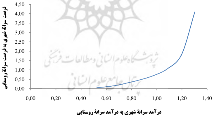
نمودار ۳. تغییر درآمد سرانه با تغییر فرصت‌های سرانه

نتایج به دست آمده حاکی از آن است که با افزایش نابرابری در فرصت‌ها شاخص نابرابری در درآمد سرانه رشد سریع تری دارد. به عبارت دیگر، با افزایش نابرابری فرصت‌ها، شکاف درآمدی بیش از شکاف فرصت‌ها بزرگ می‌شود. از این مسئله نتیجه‌ای بسیار مهم استخراج می‌شود یا به عبارتی این پدیده نشان می‌دهد که با «کاهش نابرابری فرصت‌ها می‌توان کاهش بیشتری در نابرابری درآمدی مشاهده کرد».