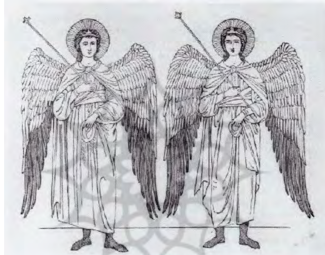
Above picture of Archangels