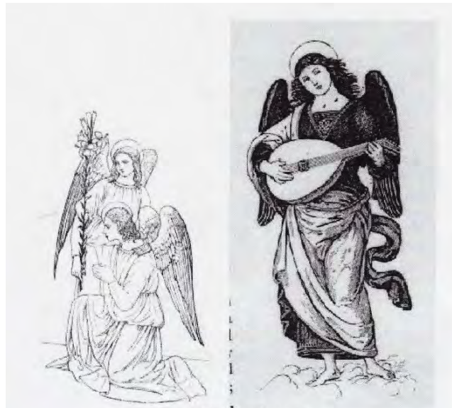
Above pictures of Angels