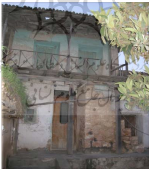
عکس شماره ۱: ساده‌ترین شکل خانه‌ها در روستا با قدمت بیش از ۱۰۰ سال

در این قسمت قدیمی‌ترین خانه‌های روستایی و یا مخروبه‌هایی از این خانه‌ها را می‌توان شاهد بود. روند شکل‌گیری بنا در روستا نشان می‌دهد که سکونتگاه‌های اولیه مردم بسیار ساده و ابتدایی بوده و هنوز هم نمونه‌هایی از آن در منطقه دیده می‌شود (عکس شماره ۱). اما در کنار این مساکن ساده با توجه به توان فرد استفاده‌کننده سکونتگاهها به اشکال پیچیده تری تغییر یافته‌اند. ساده‌ترین شکل خانه‌های روستایی در این منطقه قرارگیری یک یا دو اتاق در کنار هم است، اما به مرور به شکل خانه‌های سه اتاقه با طبقات مختلف و چند گانه نیز شکل گرفته است. این مساکن دارای کاربری کشاورزی، دامداری و صنایع دستی و سایر فعالیت‌هاست.