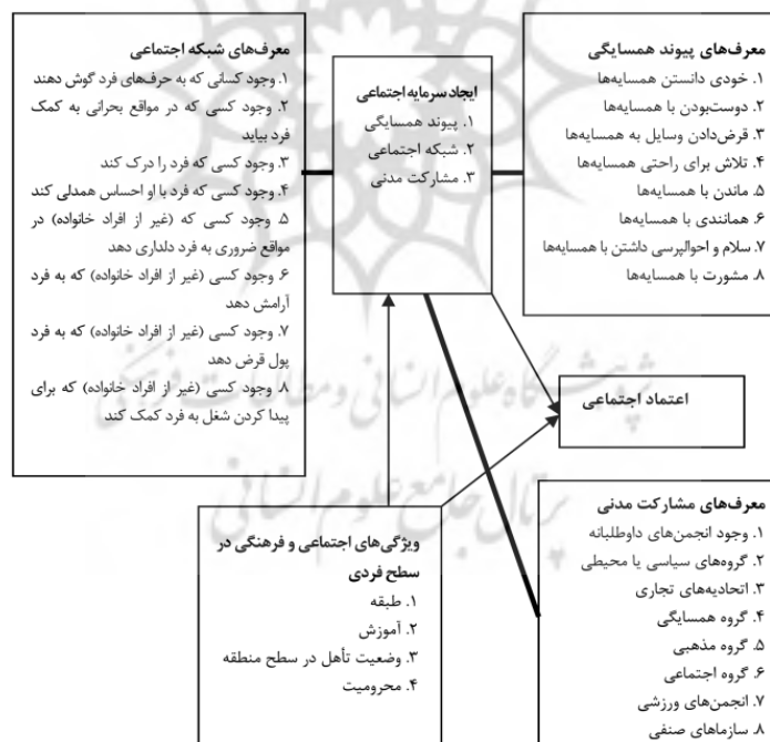
نمودار ۲. مدل تحلیل سرمایه اجتماعی ارائه‌شده توسط لی، پیکلز، و ساویچ

در این پژوهش، با استفاده از الگوی لی (Lei)، پیکلز (Pickles)، و ساویچ (Savic)، به ارزیابی سرمایه اجتماعی در سطح شهر پردیس پرداخته می‌شود. علت استفاده از این الگو توجه قابل ملاحظه آن به اجتماعات محلی است. هر چند سطح تحلیل ما در این پژوهش شهر است، لیکن سرمایه اجتماعی، به‌خصوص در سطح فردی، در عرصه اجتماعات محلی شکل گرفته و در این عرصه قابل لمس است. شکل کلی این مدل در نمودار ۲ قابل مشاهده است. در این الگو شاخص‌ها و گویه‌های مورد نظر ارائه شده است. همان‌طور که ملاحظه می‌شود، تأثیر عرصه تحلیل، یعنی اجتماع محلی، در نوع‌گزینش سنجه‌های پژوهش مشهود است.