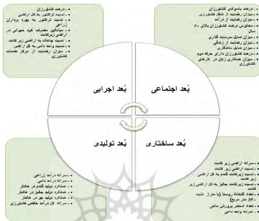
شکل ۱: ابعاد و شاخص‌های ارزیابی توسعه کشاورزی