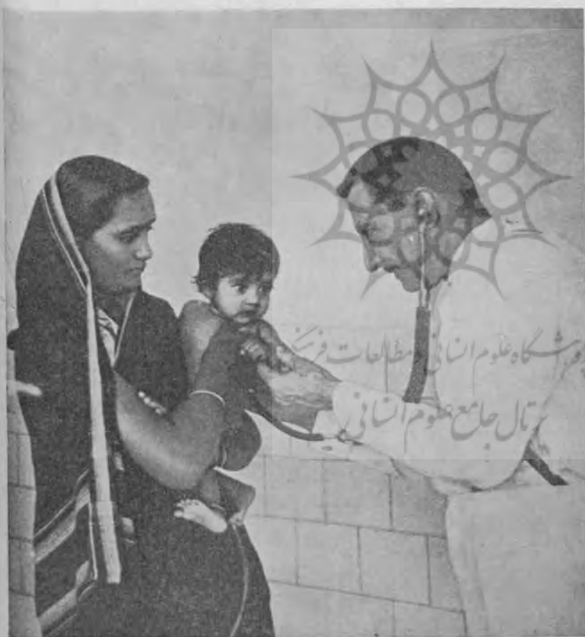
پزشکی است که طفل کارگر را معاینه میکند

بعهدده دارند . در هر کارخانه که عدم نسبتاً زیادی از زنان کارگر استخدام شده اند پرورشگاههای عمومی که در زیر نظر بانوان آرموده اداره میشود ایجاد شده تا اطفال این زنان را در ساعات کار پرستاری نمایند . مسئله آموزش کارگران و اطفال آنها نیز مورد توجه واقع گردیده . در اغلب کارخانه‌ها و سائل تحصیل تا پایه متوسطه وجود دارد . برای کارگران بیسواد نیز کلاسهای ایجاد شده و بدینوسیله ایشان در ساعات بیکاری معلومات مقدماتی و ضروری اولیه را فرا میگیرند . بعضی از