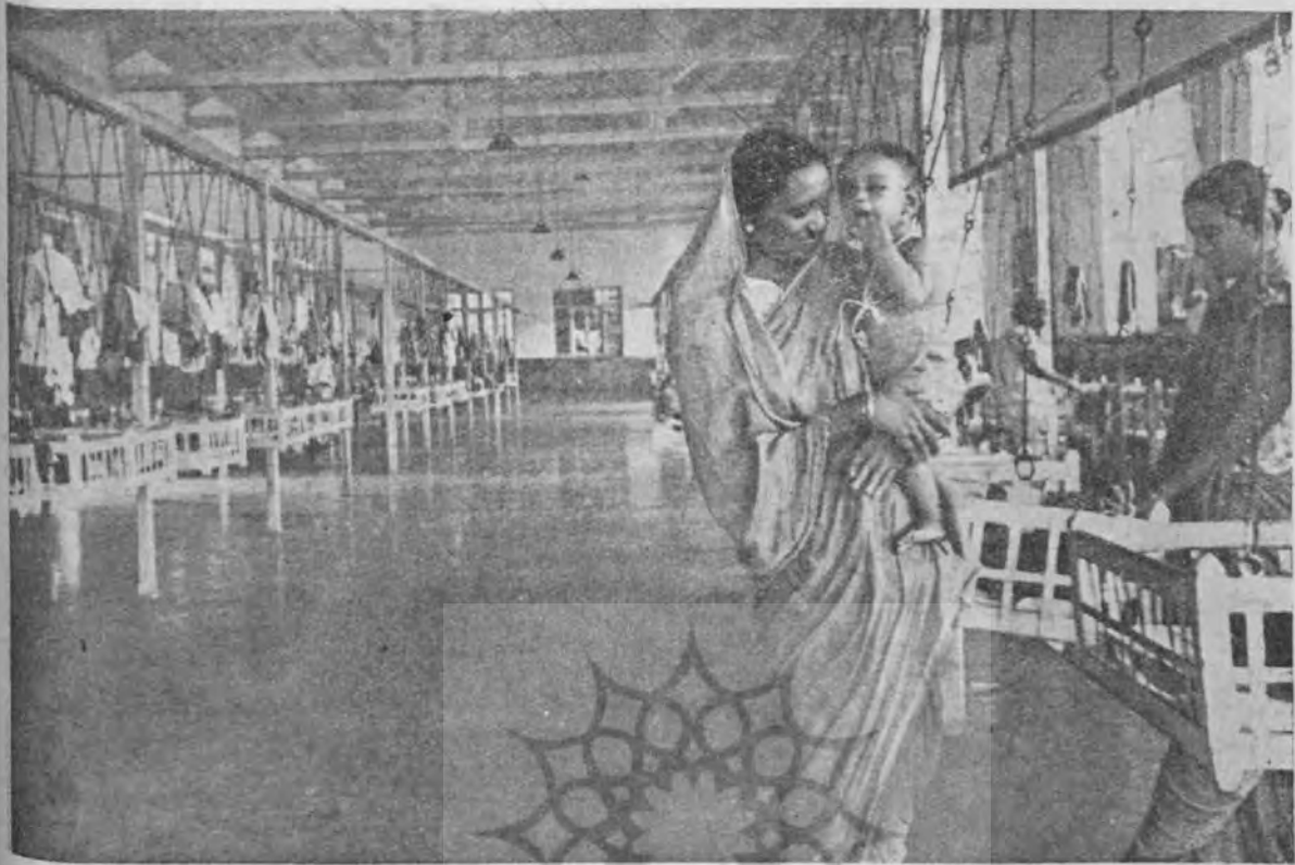
پرورشگاه اطفال مادرانیک در کارخانه نساجی بمبئی مستخدمند