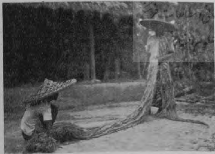
كف كه محصول آن منحصر به هندوستان است

و خيمي را براي هندوستان در برداشت در سالهاي ۱۹۲۹ و ۱۹۳۰ صادرات هندوستان چه از حيث ارزش و چه از لحاظ مقدار بنهايت در چه رسیده بود كه يكبار در اثر بحران تجارتي جهاني تنزل فاحشي در بهاي مواد غذائي رخ داد. نيمي از صادرات هند عبارت بود از مواد غذائي و در سالهاي ۱۹۳۱ و ۱۹۳۲ ارزش اين مواد به نيمي از بهاي اصلي خود تنزل يافت. تنزل كلي در بهاي برنج، دانههاي نباتات روغني، جوت هندي و پنبه وضعيت نا مساعدی را براي هندوستان از لحاظ خريد کالا از خارج و پرداخت