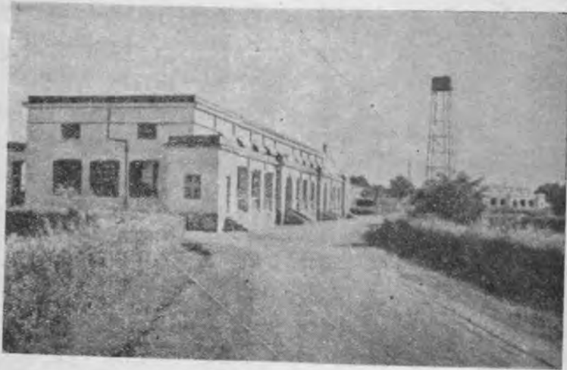
بنگاه تحقیقات علمی در « نانکوان »

فروض بکشورهای بیگانه بوجود آورد. در نتیجه رقابت ژاپن و همچنین مناسبی برای هندوستان است که روابط تجارتنی دائمی با این کشورها