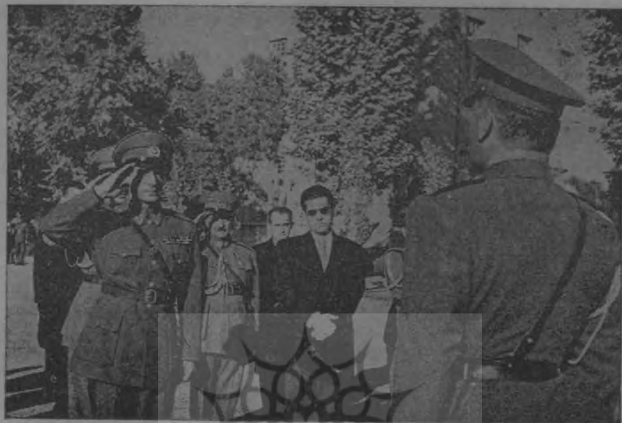
اعلیحضرت همایونی هنگام اصفاء گزارش فرمانده دانشکده افسری