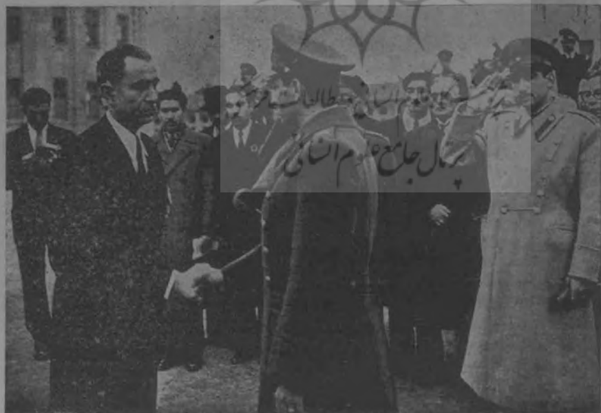
اعلیحضرت همایون شاهنشاه در جشن دانشکده افسری هنگام اعطاء نشان دانش به آقای وارسته