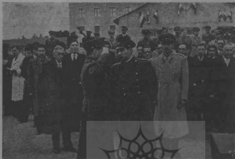
اعلیحضرت همایون شاهنشاه و هیئت دولت در جشن دانشکده افسری