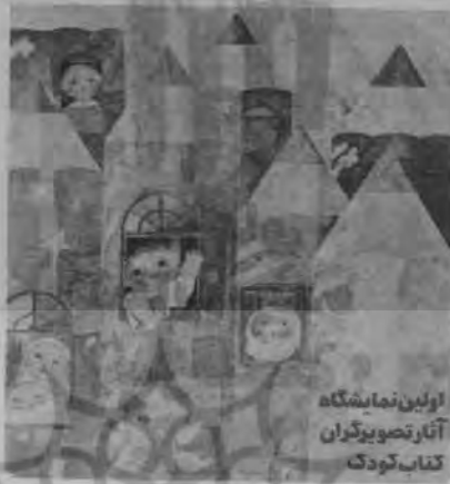
اولین نمایشگاه آثار تصویرگران کتاب کودک

خود است. کودک نیازهای خود را از طریق کار هنری خود بیان می‌کند و والدین از این راه می‌توانند به نیازهای کودکان واقف شوند. والدین نباید خود را به کودک تحمیل کنند، باید که بگذارند او خودش باشد. اگر بچه دوست دارد همیشه را آبی رنگ کند، بگذارید آزادی چنین عطی را داشته باشد زیرا کودک سبب را به دلایلی در ذهن خود آبی می‌بیند. اصولاً کار هنرمند آنست که چیزی را از طبیعت بگیرد و از آن چیز دیگری بسازد که در طبیعت وجود ندارد. بگذارید بچه‌ها هم هنرمند بشوند.