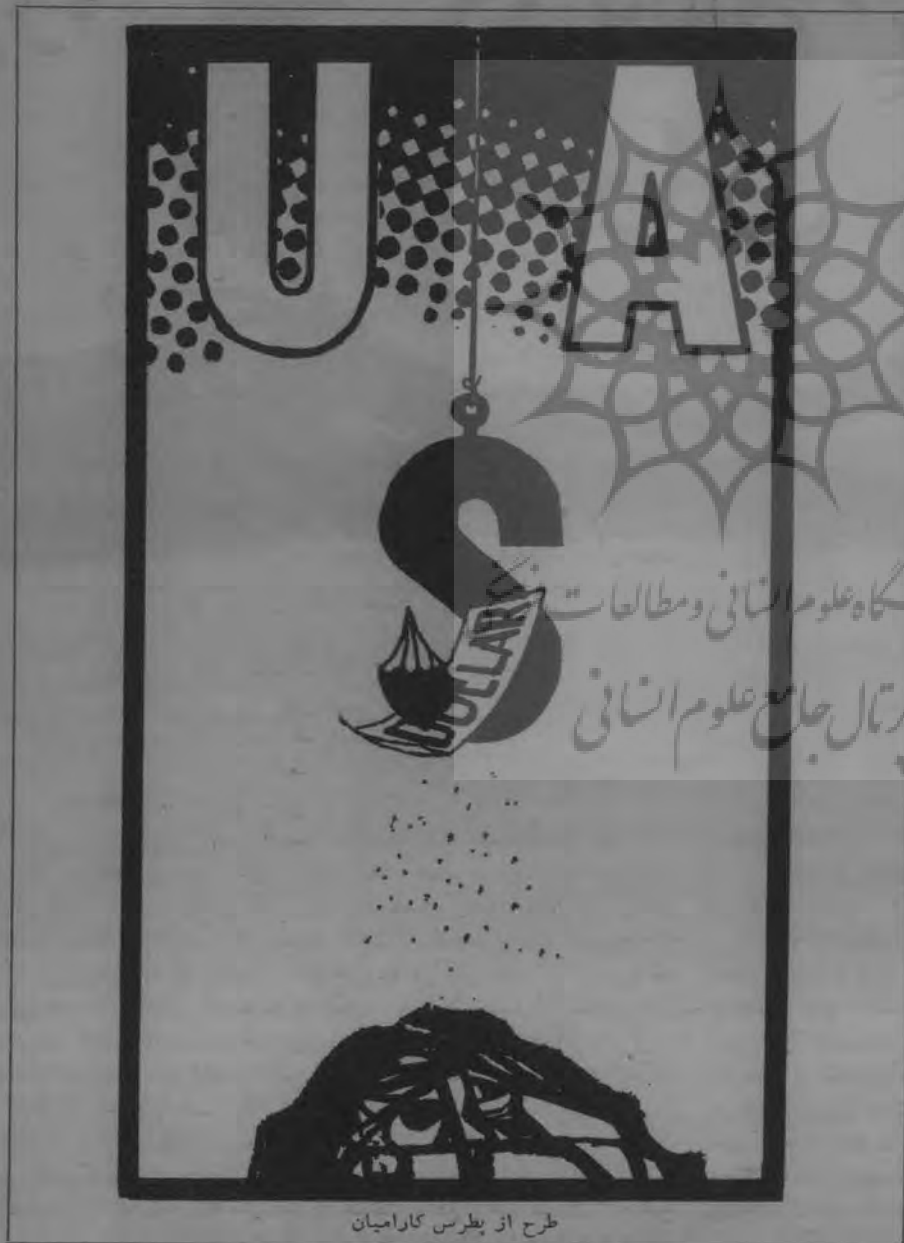
طرح از پطرس کارامیان

به پیشنهادات گزارش راکفلر که بنگریم ، و امکانات اجرای این پیشنهادات را که درنظر آوریم ، متوجه عدم امکان تحقق پذیرفتن این پیشنهادات و عدم تغییر در روال ناخوشایند شرایط آمریکای لاتین خواهیم شد .