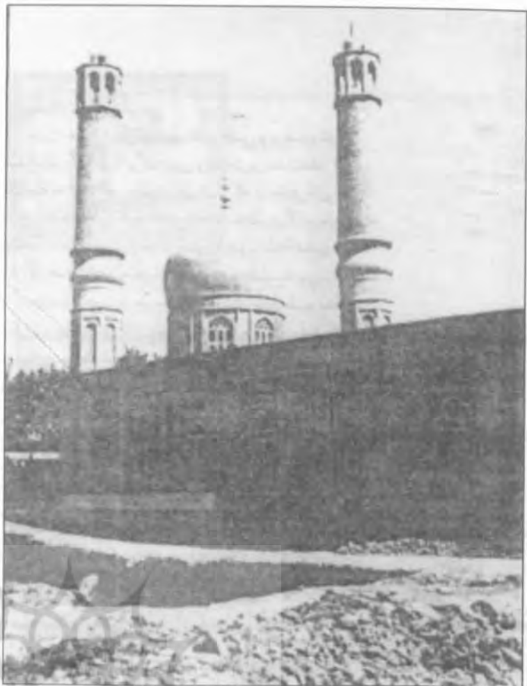
امامزاده احمد خوانسار

همت استاد بزرگ، علامه وحید بهبهانی و به همیاری و تلاش فراوان افرادی مانند محققان خوانساری، موج اخباریگری آرام گشته و عقل و منطق در خدمت اخبار و آیات قرآن کریم دانش دین را توانمند نمود.