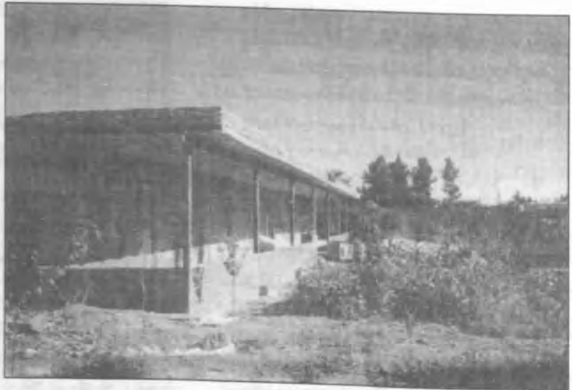
مدرسه علمیه صادقیه در حال اعداد

در گزارش بعدی از مدرسه علمیه شمس، وضع حضور روحانیون در منطقه و بویژه حضور خانواده پرفیض و برکت مرحوم استاد شهید مطهری سخن خواهیم گفت.