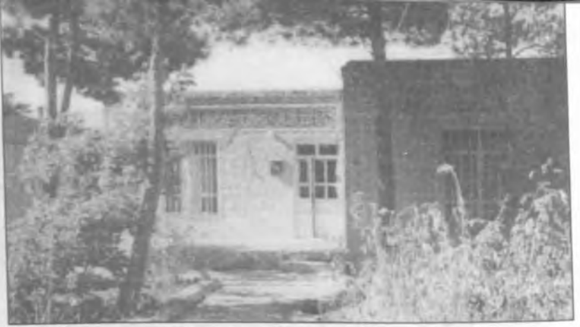
مدرسه علمیه صادقیه