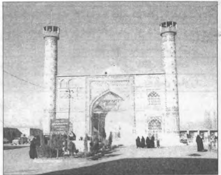
شهرعتیق (کهنه) قوچان - امام زاده ابراهیم موسی‌ابن جعفر(ع)

بد نیست بدانید منطقه قوچان از نظر طبیعی مساعد و دارای آب‌وهوای مطبوع و معتدل است. برخی از سالها به خاطر سردی هوادرختان یک ماه پس از عید برگ نمی‌دهند. تپه‌ها در بهار سرسبز و خرم به نظر می‌رسد. این منطقه با چراگاههای خراب