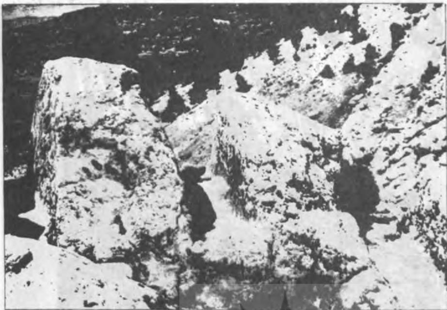
نمایی از کنگرهای پام غار ماهی بازان

سده‌های بسیار دور که متن آن به زبان فارسی عهد باستان نوشته شده و تا به حال توسط هیچ یک از محققان ترجمه نشده از جمله اسرار شگفت‌انگیز این نقطه سیاحتی است که با اندکی توجه به سرمایه‌گذاری می‌تواند به یکی از پرجاذبه‌ترین مرکز تفریحی و سیاحتی کشور و ایجاد اشتغال تبدیل شود.