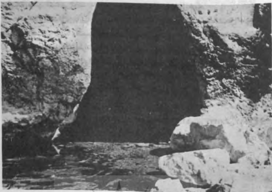
نمایی از دهانه غار ماهی پازان

اینکه خیس شود ظرف ۳۰ ثانیه مخمل سیاه تبدیل به مخمل سبز می‌شود. این معمایی است که چگونه کلروفیل با این سرعت شکل می‌گیرد و چنانچه پی به وجود این راز ببریم استفاده زیادی از آن حاصل خواهد شد.