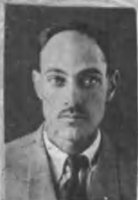
اگر کادمت خبرنگاری فائز عکس خبرنگار و همراهِ اسفندی ۱۳۶۳ و با من مرکز استنساخندهش باشد از این عکس استفاده شود