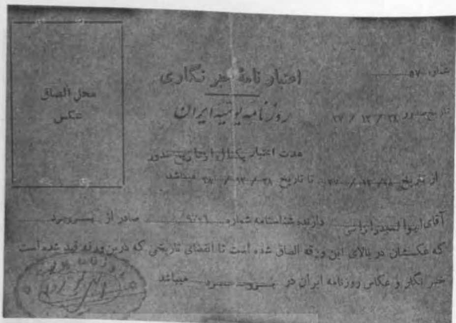
تصویر کارت خبرنگاری روزنامه ایران