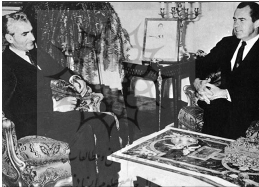
نیکسون، معاون آیزنهاور در کنار محمدرضا شاه پس از کودتای امریکایی ۲۸ مرداد

از سایر گفته‌ها یا آنچه کارتر بعدها گفت و نوشت هیچ‌گاه پی نبردم که او آینده سیاست فشاری را که بر حکومت شاه وارد می‌کرد، چگونه ارزیابی می‌کرد. به راستی او فکر می‌کرد که نتیجه فشار به کجا خواهد انجامید؟ (ص ۵۰۵)