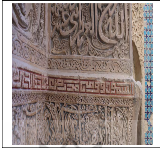
شکل (۳) نمونه‌ای از کتیبه‌های کوفی و ثلث مقبره پیربکران (عکس: نگارندگان، ۱۳۸۹).