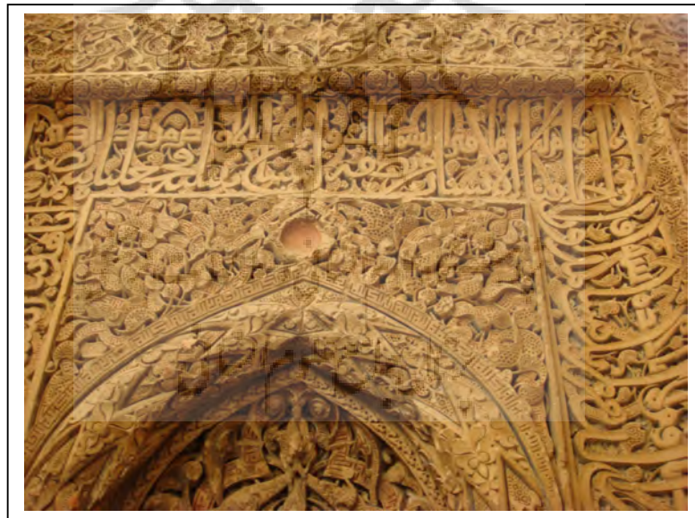
شکل (۴) کتیبه ثلث و کوفی محراب مقبره پیربکران (عکس: نگارندگان، ۱۳۸۹).