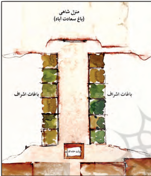
تصویر ۱. پلان محدوده خیابان برگرفته از توصیفات عبدی بیگ و سیاحان خارجی.

صفوی ترسیم کنیم. تصویری که مقایسه آن با فضای خیابان در باغ سعادت آباد که عبدی بیگ در توصیف باغ هم زمان به صورت ویژه به آنها می‌پردازد و همچنین قرار دادن این تصویر بازنمایی شده در کنار تصاویر و تفصیلات از خیابان در باغ ایرانی که قدمتی چند هزار ساله دارد، نتایج قابل توجهی را به دست می‌دهد.