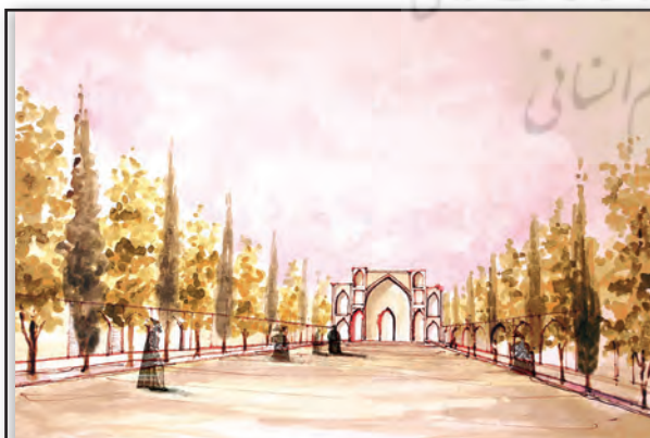
تصویر ۲. بازنمایی منظر خیابان بر اساس اشعار عبدی بیگ. مأخذ: آل‌هاشمی، مجتهدی و روح‌نیا، ۱۳۸۸.