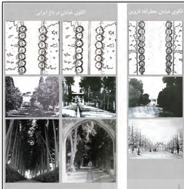
تصویر ۳. مقایسه و تطبیق الگوی خیابان در باغ ایرانی و خیابان جعفرآباد قزوین، مأخذ: نگارنده.