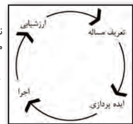
نمودار ۱. چرخه معمول فرآیند طراحی مأخذ: Motloch, 2000:286

می‌توان گفت به تعداد طراحان، فرآیندهای طراحی وجود دارد، اما همگی آنها از ویژگی‌های مشترکی برخوردار هستند [ماتلاک، ۱۳۷۹: ۵۱۱]؛ (نمودار ۱). فرآیند طراحی، خطی نیست و بعد مشخص و استاندارد ندارد، بلکه مبتنی بر تبدیل مداوم و بکارگیری ابعاد گوناگون دانش است. لذا این فرآیند را می‌توان چرخه‌ای و پیش‌رونده دانست. فرآیند طراحی ممکن است با مشاهده مسئله‌ای، داشتن ایده‌ای، خلق فیزیکی چیزی یا با ارزیابی وضعیت خاصی آغاز شود. طراحی، فرآیندی هدفمند است که طراحان به دنبال یافتن نقطه‌های پایانی و بهترین راه حل هستند. به عبارت دیگر، همه به دنبال ایده یا ایده‌هایی برای تصمیم‌گیری درباره مورد یا حل مسئله هستند. هنگام طراحی، شباهت بسیاری بین روش کار معماران منظر و معماران وجود دارد. بسیاری از این فرآیندها در متون گوناگون و توسط افراد مختلف منظم و جمع‌آوری شده و از