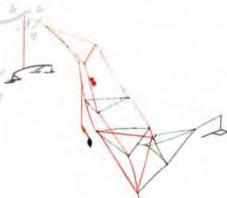
برج دوشاخه، ۱۹۵۰، فلز رنگ شده و سیم و چوب

به او لقب «موتسارت فضا» داده بودند. کالدِر به مردم شادی می‌بخشید و مورد علاقه و تحسین آنان بود. او در جایگاه معدود هنرمندانی است، که نظرات و هنرش، به قرن بیستم، ویژگی می‌بخشید.