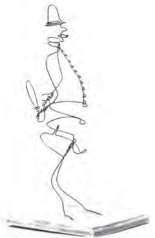
دژبان، ۱۹۳۰، سیم

کالدور هنر خود را بر روی هر ماده‌ای که بتوان از آن مجسمه ساخت، آزمایش می‌کرد. او از وسایل عادی و بدقواره روزمره تا چوب و فلز که با رنگ‌های اولیه رنگ شده بود، استفاده می‌کرد. کالدور با پیکره‌های سیمی خود، نقش به‌سزایی در چهره‌پردازی داشت و مروج دستاوردهای هنرمندان کوبیست و فوتوریست در این زمینه شد. (تصویر ۲)