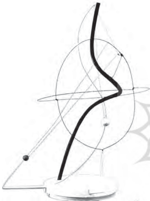
گیتی، ۱۹۳۴. مجسمه متحرک مجهز به موتور، لوله آهنی رنگ شده، سیم، چوب، ریسمان

می‌نشست و با صداها و حرکاتی که از خود درمی‌آورد به عروسک‌ها جان می‌بخشید. (تصویر ۳) تماشاگران کالدور هنرمندان سنت‌شکن و منتقدان هنری بودند. او در سال ۱۹۲۶ به پاریس سفر کرد، و در آن‌جا با هنرمندان بسیاری آشنا شد. در سال ۱۹۲۹ اولین نمایشگاه انفرادی خود را برگزار کرد و در آن مجسمه‌های سیمی و چوبی‌اش را به نمایش گذارد. اما یک سال بعد، آغاز ورود او به دنیای