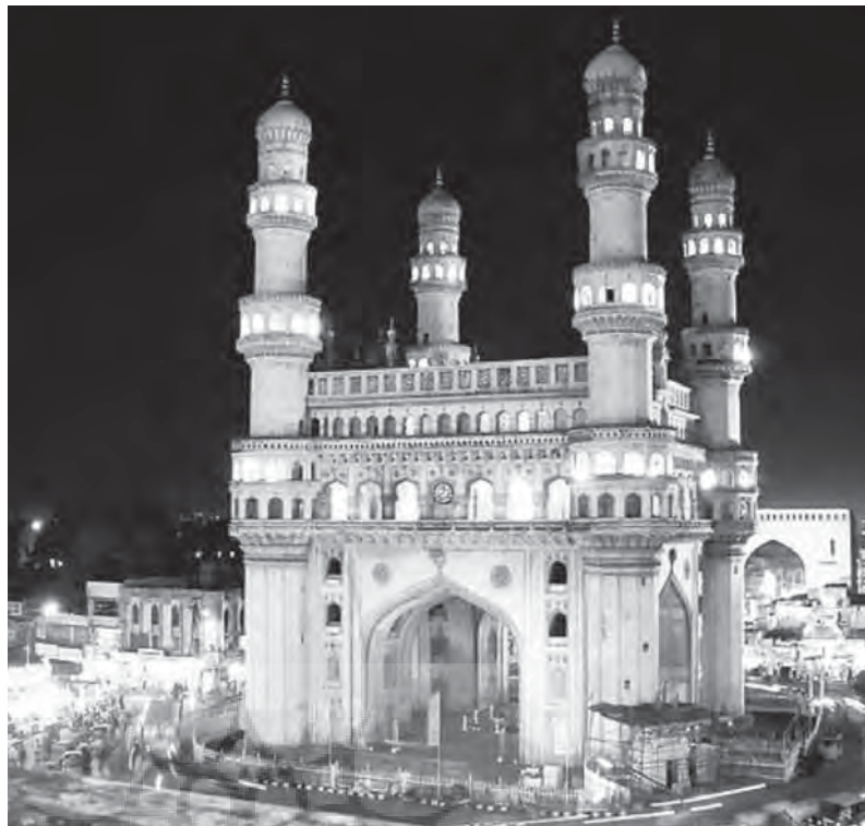
چهار منار، حیدرآباد

او مولانا احمد بن ابو احمد قزوینی را که در زمان وی به دکن رسیده بود، به‌جای ملک غوری وکالت مطلق داد. ۸۰ همچنین امیر غیاث‌الدین شیرازی با دستور وی به‌عنوان «مفتی» تعیین شد. ۸۱ که در زمان فیروزشاه بهمنی نیز در این مقام باقی ماند. ۸۲ مولانا لطف‌الدین سبزواری هم در زمان پادشاهی فیروزشاه در گلبرگه نایب‌السلطنه بود. ۸۳ فیروزشاه در همان گلبرگه مولانا تقی‌الدین شیرازی را به‌عنوان وزیر مالیات تعیین کرد. ۸۴ احمدشاه ولی نیز به همین روش حکومت می‌کرد. او سه‌هزار تن را از عراق، عثمانی، سرزمین‌های عربی، خراسان و ایران برای امور اداری و درباری