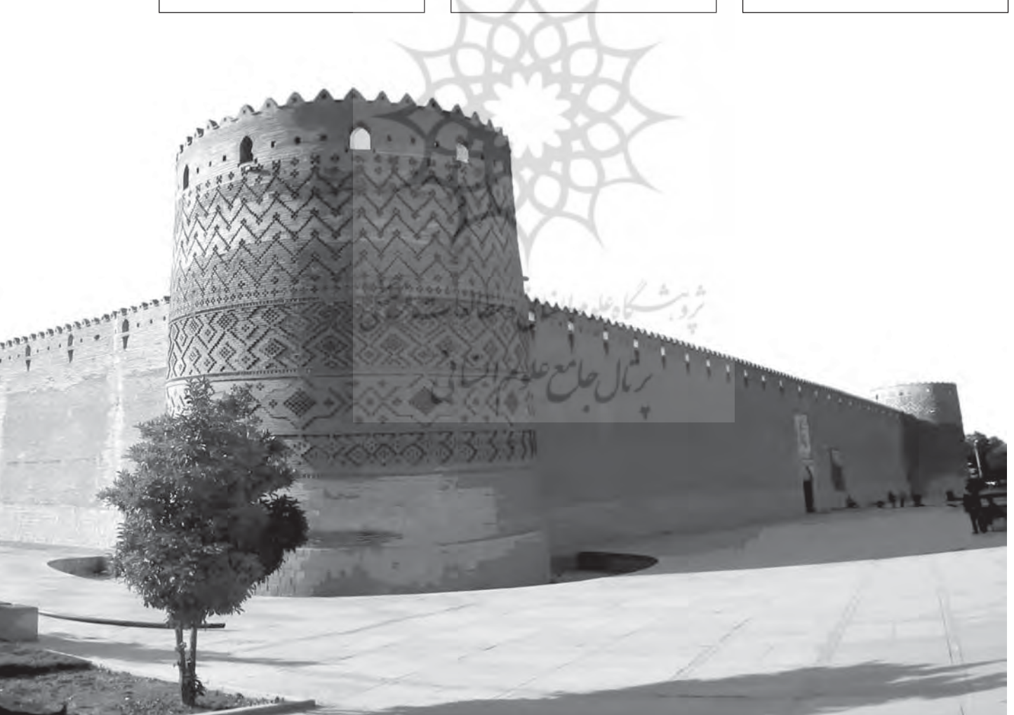
ارگ کریم خان، شیراز

در هر حال باتوجه به دلایلی که ذکر کردیم، کریم‌خان «تدمیر عمرپاشا و تسخیر اُم‌البلاد بصره و دارالسلام بغداد و سایر ولایات تابعه او را پیشنهاد همت والا فرمودند.» و چون از رفت و آمد سفرای نیز نتیجه‌ای حاصل نشد، خان زند سپاهی بزرگ را به فرماندهی برادرش صادق‌خان مأمور تصرف بصره کرد.