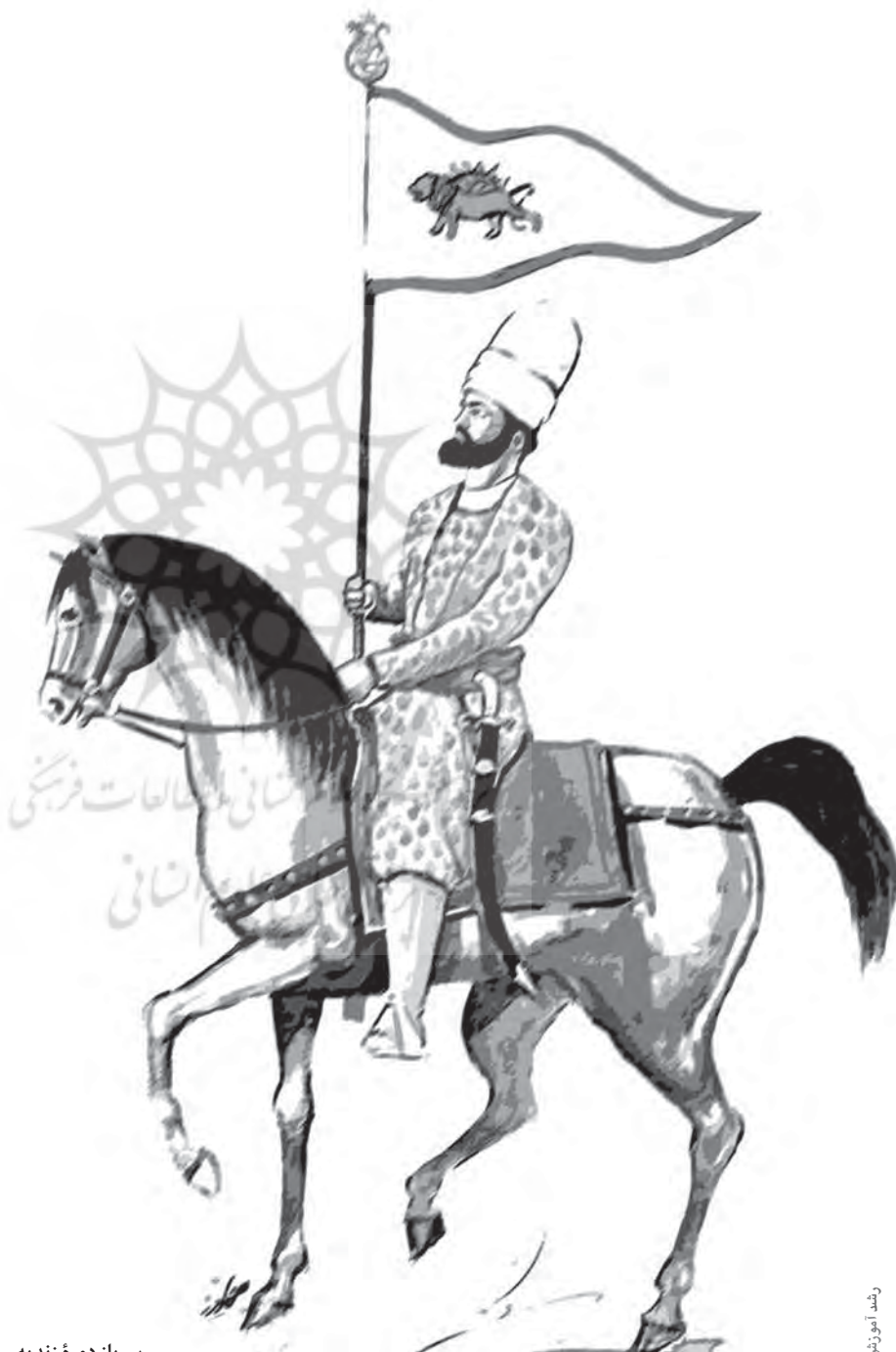
سر باز دوره زندیه

چون یک سر زنجیری که قایق‌های پلی را نگه داشته بود، در خاک ایران به میخ‌ها و ستون‌های بزرگ و محکم بسته شده بود، و سر دیگر آن باید در ساحل مقابل بسته می‌شد، نیاز به شناگران ماهر و با جرئتی نیاز بود تا با عبور از آب خروشان اروند، این اقدام را عملی کنند. در این جا بود که شجاعت بختیاری‌ها و مهارت‌های خاص آنان که لازمه زندگی کوچ‌روی آنها بود، به کار آمد. به گزارش منابع عصر زندیه، بختیاری‌ها نقش مهم و مؤثری در ساختن پل و عبور سپاه ایران از اروندرود و رسیدن به بصره داشتند. آنان با استفاده از مشک‌های پر از هوا و مهارت در شناگری، به آسانی از رود گذشتند و در آن سوی آب منتظر رسیدن مصالح لازم برای احداث پل شدند. پس از پایان عملیات احداث پل که حدود ۱۸