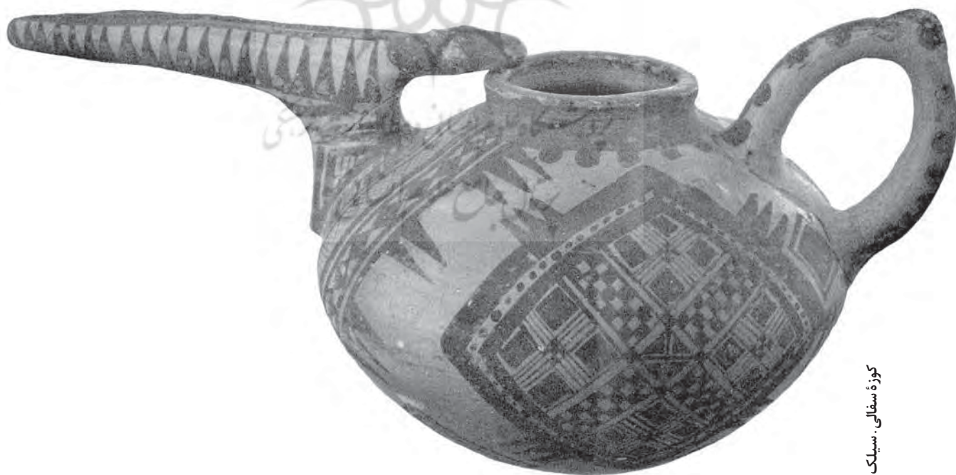
کوزه سفالی، سیلک

توجه به ابزار کشاورزی، پرفسور داماس ۱۲ نوشته است که آسیاب بادی برای اولین بار در جلگه ایران ساخته شده است؛ جایی که بادهای دائمی آن را می‌چرخاند. اختراع مهم دیگر انسان‌های اولیه، بافتن پارچه است. داماس می‌نویسد: در گورستان شوش تبرهایی یافته شده که با پارچه‌هایی به رنگ تبراها بسته شده بوده است. تجزیه شیمیایی پارچه‌ها نشان می‌دهد، آن‌ها از پارچه‌های متفاوتی ساخته شده‌اند. برخی از آن‌ها کتان بوده است با تار و پود خوب بافته شده. امروزه حتی با پیشرفت ابزار، قادر به تولید پارچه بافته شده به زیبایی ۵۰۰۰ سال پیش نیستیم. اما آخرین و نه کمترین آن‌ها، معماری است. کشف خانه‌های گلی در دهلران در هزاره هفتم ق.م. و یک مهر چاپی شش هزار ساله در شوش و اولین گنبد دایره‌ای شکل که پشت‌بام خانه بوده است، نشان‌دهنده پیشرفت این مهارت و استادی در ایران است. همه حقایق تبارشناسی باستان‌شناسی که به‌طور خلاصه در این مقاله اشاره شده‌اند، نشان‌دهنده آن است که اولین مهد و مکان شکل‌گیری انسان هوشمند و ناطق، ایران بوده است؛ همان سرزمین افسانه‌ای که نژاد آریایی از آن جا برخاست و در دیگر نقاط جهان پراکنده شد.