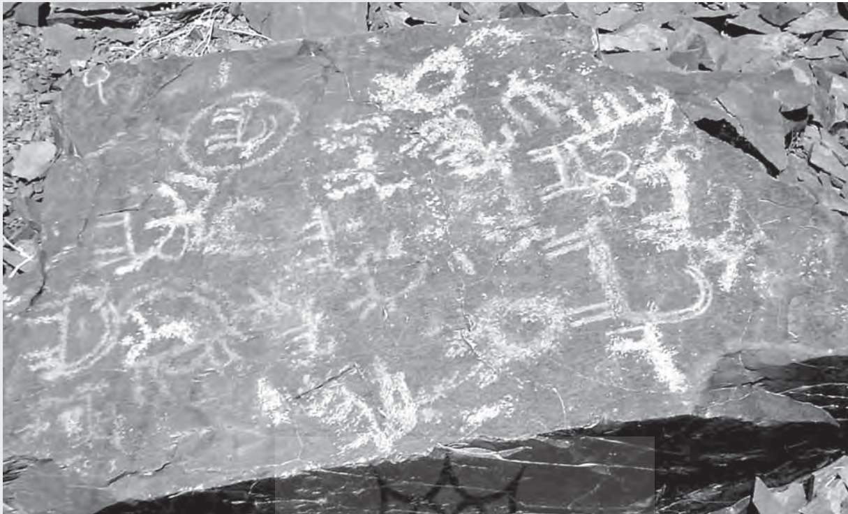
نقاشی صخره‌ای مکشوفه در خمین ۱۲۰۰۰ سال پیش

توسط ایرانیان است. بقایای سفال‌های یافت شده در ایران و مصر به ترتیب به تاریخ نه هزار و هفت هزار سال قبل می‌رسد. هم‌چنین حائز اهمیت است که بدانیم، سفالینه‌های قدیمی که با چرخ سفال‌گری ساخته شده‌اند و ظرف‌های قدیمی لعابی، در فلات ایران یافت شده‌اند. گورستان که قدمت آن به ۵۰۰۰ سال پیش می‌رسد، کوزه‌های بزرگ آب که با چرخ‌های سفالگری ساخته شده و با خمیر نازکی (لعاب) پوشانده شده بود، یافت شده است. کوزه‌های متالگی و درخشان باریک که پشت آن‌ها به رنگ مایل به قرمز است بدان معناست که برای رنگ کردن از اکسید آهن استفاده شده است.