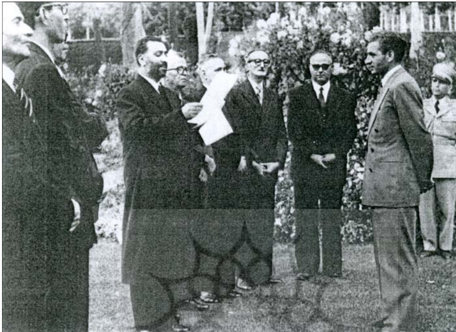
نخستین دیدار خاخام شوفط با محمدرضا شاه پس از ماجرای ۲۸ مرداد