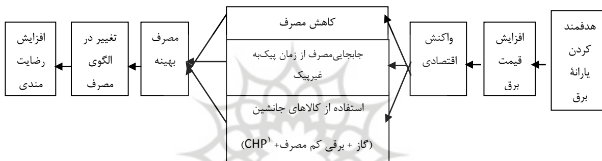
مدل ۱: واکنش اقتصادی ناشی از هدفمند کردن یارانه برق

بنابراین واکنش اقتصادی مشترکین خانگی در هدفمند کردن یارانه برق را بصورت نمودار زیر می توان نمایش داد.