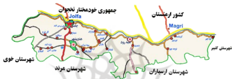
شکل 2 منطقه آزاد ارس (شهرها و کشورهای همجوار)

طرح پایه آمایش استان آذربایجان شرقی معتبرترین و به‌روزترین سند فرادست موجود به‌شمار می‌آید. این طرح مبنای تمام تصمیم‌گیری‌های آمایشی و بخشی استان قرار گرفته است و مأموریت‌ها و وظایف اصلی استان و برنامه‌های اجرایی در قالب برنامه توسعه پنج‌ساله و سالانه استان همسو با تحقق اهداف مصوب این سند صورت می‌گیرد (شورای آمایش سرزمین، 1384).