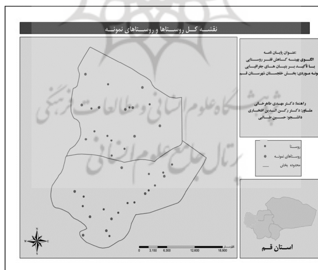
شکل ۳ توزیع جغرافیایی روستاهای نمونه