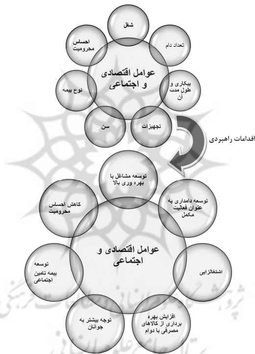
شکل ۵ اقدامات راهبردی در جهت کاهش فقر روستایی با تأکید بر فقر غذایی

تشدید کننده فقر روستایی با تأکید بر فقر غذایی بوده‌اند، در این صورت به نظر می‌رسد الگوی بهینه کاهش فقر غذایی در مناطق روستایی باید ترکیب متعادلی از عوامل فوق را مورد توجه قرار دهد. مبانی نظری تحقیق مبین آن است که عوامل اجتماعی و اقتصادی، فقر غذایی را شکل می‌دهند و از سوی دیگر، عوامل و زمینه‌های اقتصادی نقش بیشتری را در این راستا ایفا می‌کنند. بر اساس محورهای مورد تأکید در یافته‌های تجربی تحقیق می‌توان شکل ۵ را در جهت کاهش فقر روستایی با تأکید بر فقر غذایی پیشنهاد کرد.