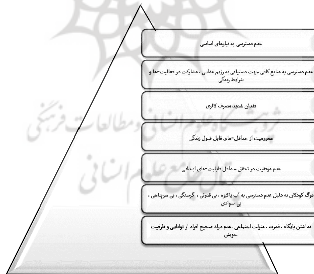
شکل ۲ خلاصه‌ای از مشخصه‌های فقر (فیروزنیا، رکن‌الدین افتخاری، ۱۳۸۲؛ ازکیا، ۱۳۸۱)

براساس تعاریف موجود بسیاری از محققان فقر را به دو دسته فقر مطلق یا اولیه و فقر نسبی یا ثانویه تقسیم می‌کنند. فقر اولیه به این معناست که خانوارها توانایی تأمین حداقل نیازهای تغذیه برحسب ارزان‌ترین انواع مواد انرژی را ندارند. فقر ثانویه مرحله‌ای است که نیازهای اساسی و اولیه خانوار برآورده می‌شود، اما نیازهای ثانویه مانند آموزش کافی تأمین نمی‌شود (پروین، ۱۳۷۲). برای فقر مشخصه‌های متعددی در نظر گرفته شده که در تعریف فقر نیز به آن پرداخته شده است. شکل ۲ به طرح پاره ای از این مشخصه‌ها پرداخته است.