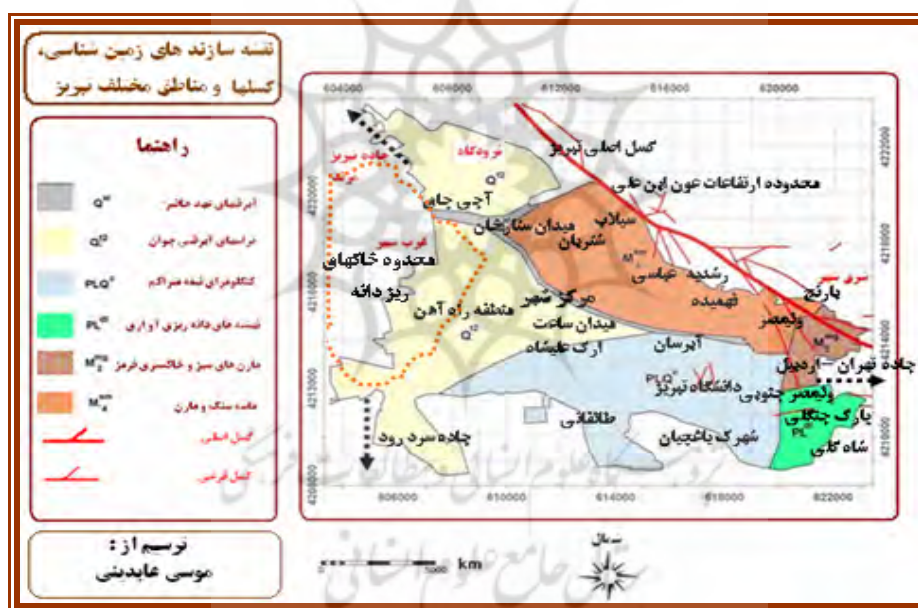
شکل ۶- نقشه سازندهای زمین شناسی و گسلها و مناطق مختلف شهر

چقدر از وسط شهر در جلگه تبریز به سمت آذرشهر و دریاچه اورمیه، مواد دانه ریزتر (رسی و سیلتی نمکدار) می‌شوند. در شکل (۶) محدوده این سازندهای رمنده (collapsible)، واگرا (Dispersive) و متورم شونده (Expansive) که برای ایجاد فونداسیون سازه‌های عظیم مسأله دار هستند نشان داده شده است. زهکشی نامناسب، بالا بودن آبهای زیر زمینی، وجود املاح نمکی و آهکی در سازندهای رسی و خطر سیلاب گیری، رشد و توسعه شهر را به سمت غرب محدود نموده است. بخش‌های شمالی و جنوبی شهر نیز به دلیل برخورد با موانع و تنگناهای