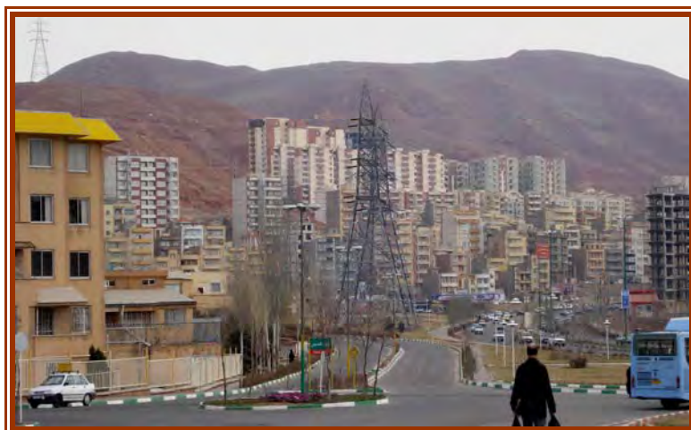
شکل ۴- ساخت و سازهای جدید در روی سطوح شیبدار در منطقه گسلی

(نشست، ریزش و خزش، رانش زمین و...) از جمله تنگناهای ژئومورفیک محسوب می‌شوند. شکل (۵) بخشی از محدوده نامناسب و بسیار مخاطره آمیز (اراضی مارنی شیبدار، مجاور گسل تبریز) برای کاربری‌های مسکونی در شمال، شمال شرق و جنوب شرق را نشان می‌دهد. بخش شمال و شمال شرق شهر بشدت گسل خورده و طول گسلهای واقع در محدوده مقرر شهر از ورودی شرقی جاده تهران تبریز، تا خروجی از تبریز به مرند (در شمال غرب شهر در منطقه فرودگاه تبریز) بیش از ۴۳ Km برآورد شد. در بخش شمالی شهر، ریزش کوه در مسیر گسل فعال، لغزش سازندهای مارنی و انحلال در بخش شهرک ولعیصر و گلپارگ اجتناب ناپذیر است. نشست و به داخل زمین فرو رفتن ساختمان مجتمع مسکونی گلپارک در سال ۱۳۸۱ نمونه‌های از اثرات تشدید انحلال سازندهای آهکی و مارنهای آهکدار بستر شهر در همین منطقه بود (شکل، ۴). ترک برک داشتن و کج شدن ساختمانهای قدیمی خوابگاه دانشجوی ولعیصر و نیز دیواره مدرسه و چندین ساختمان مسکونی از جمله مستندات بارز از ناپایداری بستر