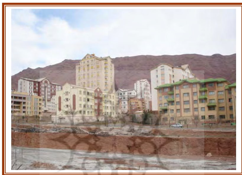
شکل ۵- ساخت و سازهای جدید در روی سطوح شیبدار در منطقه گسلی

شهر تبریز در این نواحی است تحقیقات میدانی (رجایی، ۱۳۷۳، ۲۵۲ تا ۲۵۷). میزان شیب و وجود پستی و بلندی زیاد در بخشهای شمال و شمال شرق و حتی جنوب شرق شهر عامل باز دارنده توسعه پایدار شهر هستند. معمولاً اراضی با میزان پستی و بلندی نسبی بین ۳۰۱ الی ۵۰۰ متر در کیلومتر مربع با