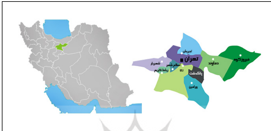
شکل (۱) موقعیت منطقه مورد مطالعه