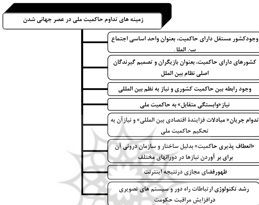
شکل (۲) زمینه های تداوم حاکمیت ملی در عصر جهانی شدن (ترسیم از: نگارندگان)

همچنین، برخی مانند «تامسون» و «کراسنر» با زیر سوال بردن این ادعا که «وابستگی متقابل»، حاکمیت را تهدید می کند، استدلال می کنند که وابستگی متقابل به جای تهدید حاکمیت، خود نیازمند آن است. حکومت هایی دارای حاکمیت هستند که به تضمین و تثبیت حقوق مالکیت می پردازند و این خود، از شرایط لازم برای جریان بین المللی کالا و سرمایه است. مطابق با این استدلال، تحکیم حاکمیت خود از شرایط لازم برای جریان یافتن مبادلات فزاینده اقتصادی بین المللی است (Thomson and krasner, 1989: 197-198). «تامسون و کراسنر»، بر این اساس، هر گونه امکان بالقوه برای دگرگونی ساختاری عمده را که از پایین در رژیم حاکمیت رخ دهد، رد می کنند (Thomson and krasner, 1989: 216)، زیرا که وابستگی متقابل پیوسته نیازمند «تداوم» رژیم حاکمیت برای حفظ و پیگیری خود است. «کراسنر» در جای دیگر نیز همین استدلال اصلی را با تفصیلی بیشتر تکرار می کند. به نظر وی شواهد و سابقه تاریخی بسیار پیچیده تر از آن است که با تصور رایج درباره تهدید کنترل موثر حکومتی از جانب وابستگی متقابل مطابقت کند. بدین معنی که، کنترل موثر حکومتی به هر حال در