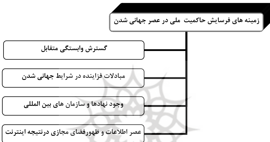
شکل (۳) زمینه های فرسایش حاکمیت ملی در عصر جهانی شدن (ترسیم از: نگارندگان)

قابل پیش بینی در جهت ایفای نقش خود به عنوان یک نهاد تأثیر گذار تداوم پیدا خواهد کرد. اما وجود یا فقدان حاکمیت به صورتی هر چه کمتر ویژگی تعیین کننده ساختار یا شیوه عمل دولت خواهد بود (کلارک، ۱۳۸۲: ۱۷۳). (شکل ۳)